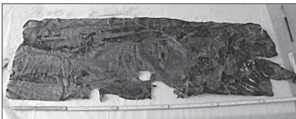
Рис. 4. Тканина савану

Вхід до склепу являв собою аркову споруду заввишки 1,3 м. За аркою розташовувався короткий дромос на ширину стіни Дюрбе (1,95 м). Сам склеп являв собою прямокутник (майже квадрат) 5,4 \times 5,6 м, вписаний у восьмикутник. Вхід до нього був у східній частині восьмикутника, вхід до Дюрбе (на другий поверх споруди) — у південній. По кутах квадрата розмішувалися складнопрофільовані ніші, в