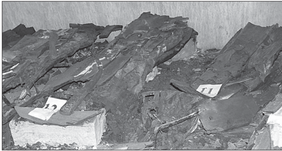
Рис. 2. Усипальниця хана Хаджі Герая