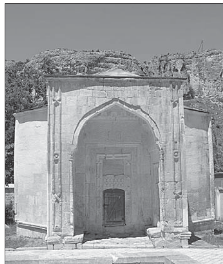
Рис. 1. Дюрбе хана Хаджі Герая

При реставраційних роботах зафіксовано певні ознаки руйнації пам'ятки: після землетрусів у XVII ст. та у 1927 р. через купол, стіни і, як потім з'ясувалось, підлогу склепу проходить глибока тріщина, яка загрожувала розвалом споруди. Західна частина Дюрбе помітно перекошена на 3° від вертикалі. Спостереження за станом підлоги усипальниці свідчать, що вона неодноразово підтоплювалась підземними водами. Інтенсивні будівельні роботи та загроза затоплення дощовими й підземними водами стали однією з причин археологічних досліджень у 2008 р. безпосередньо у склепі.