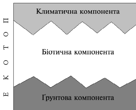
Рис. 1. Структура екотопу

сальніше, оскільки охоплює і такі ділянки, на яких біотична компонента відсутня (або її роль непомітна), що є досить важливим індикатором стану екосистем. Екотопи такого типу займають великі площі і з позицій трактування екосистем мають знаходитися у сфері класифікації останніх. У залежності від того, який компонент формує основу, - поверхню, що трансформує сонячну енергію і таким чином визначає специфіку кругообігу речовин, ми пропонуємо виділяти чотири типи екосистем (екотопів): біотоп (поверхня покрита рослинністю), гідротоп (поверхню формує водне середовище), літотоп (поверхню формують виходи геологічних порід) та технотоп (основу формує технічна споруда).