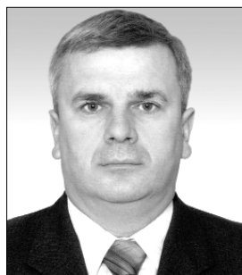
О. ПЕТРИШИН доктор юридичних наук, професор, академік АПрН України, завідувач кафедри теорії держави і права Національної юридичної академії України імені Ярослава Мудрого