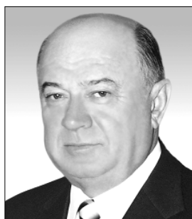
В. ТАЦІЙ доктор юридичних наук, професор, академік НАН України, президент АПрН України, ректор Національної юридичної академії України імені Ярослава Мудрого