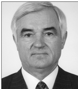
І. ТИМЧЕНКО академік АПрН України, Голова Конституційного Суду України, суддя Конституційного Суду України у відставці