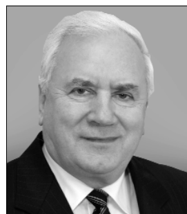
Ю. ШЕМШУЧЕНКО доктор юридичних наук, професор, академік НАН України, академік АПрН України, директор Інституту держави і права ім. В. М. Корецького НАН України