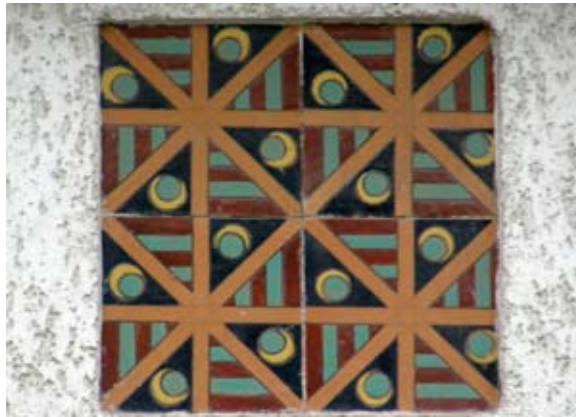
Вул. Коновальця, 108