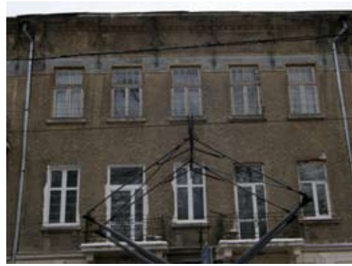
4 – вул. Франка, 69