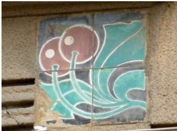
Вул. акад. Павлова, 1