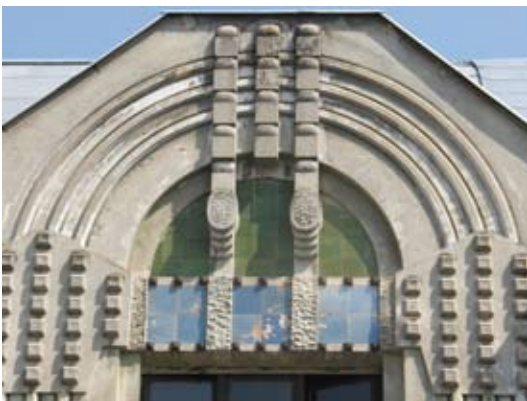
7 – вул. Донцова, 8–10