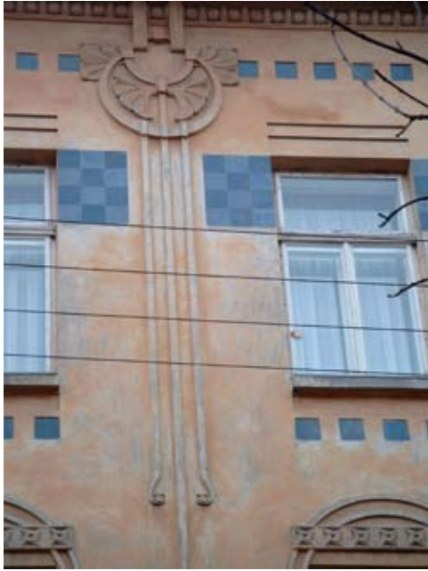
1 – вул. акад. Богомольця, 8