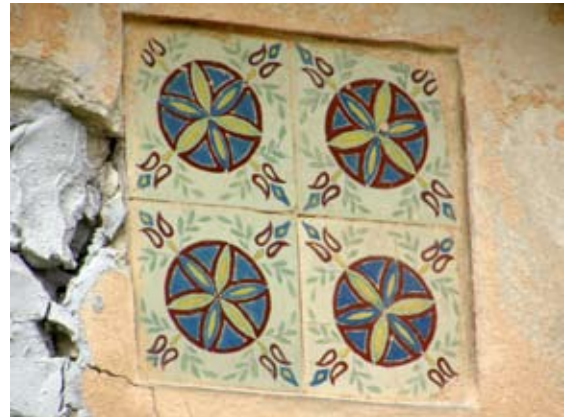
Вул. Коновальця, 110