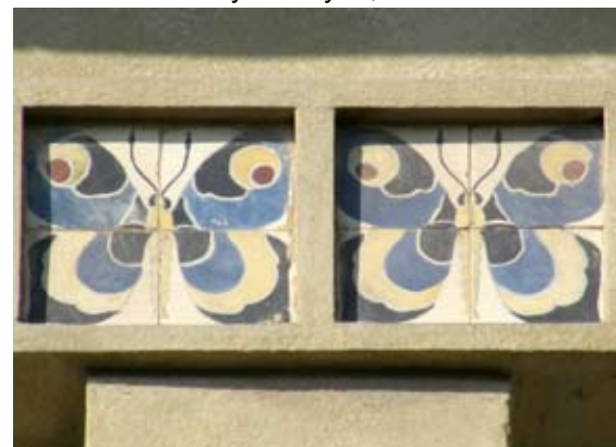
Вул. Наливайка, 9