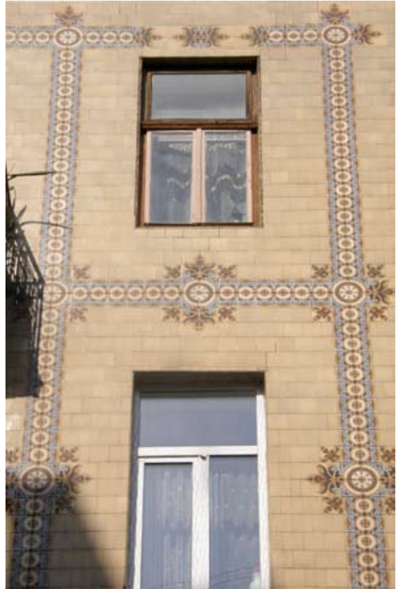
Вул. Курбаса, 5 (1907 р.)