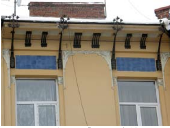
1 – вул. Руставелі, 18