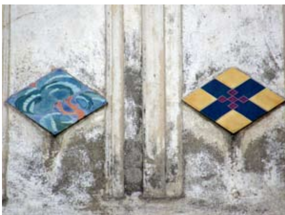
Вул. Бандери, 33