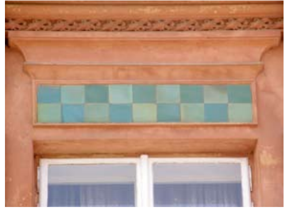
Вул. Архітекторська, 3