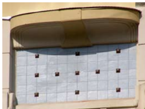
Вул. Нижанківського, 5