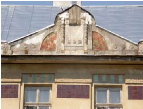
3 – вул. Донцова, 8–10