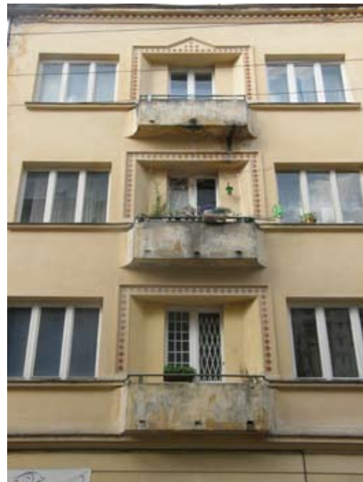
6 – вул. Ліста, 3

Іл. 12. Фрагменти фасадів, декорованих майолікою: 1–3 – орнаментальна сецесія; 4–5 – раціональна сецесія; 6 – Ар Деко