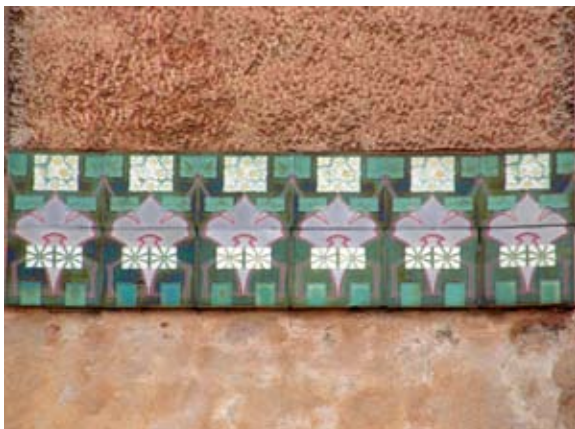
Вул. Шептицьких, 19 (1910 р.)