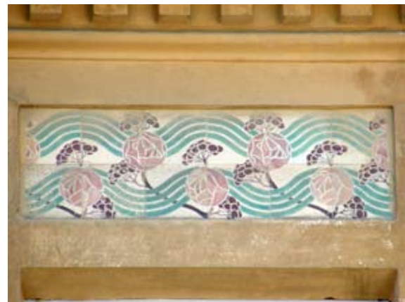
Вул. Личаківська, 70 (1906 р.)