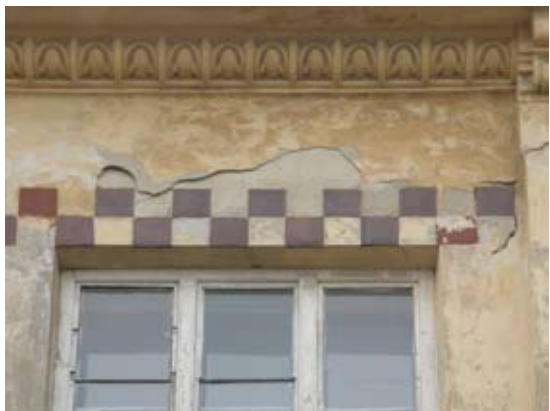
Вул. Кубійовича, 49