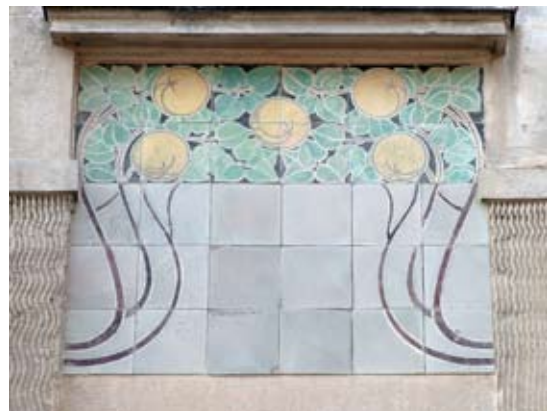
Вул. акад. Павлова, 4