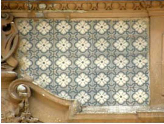
Вул. Стрийська, 3