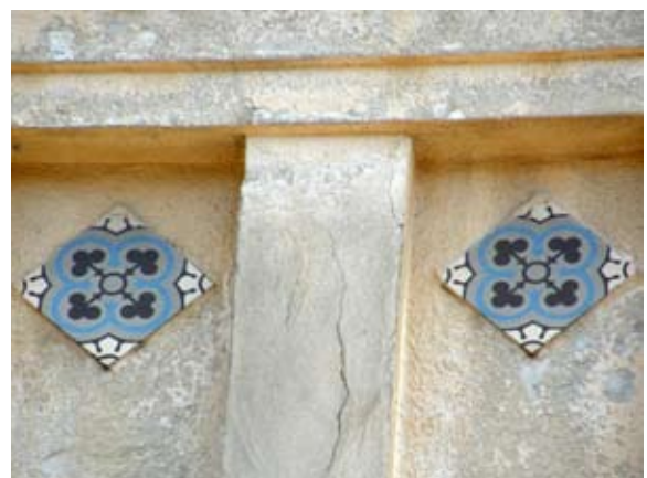
Вул. Вишеньського, 7-а