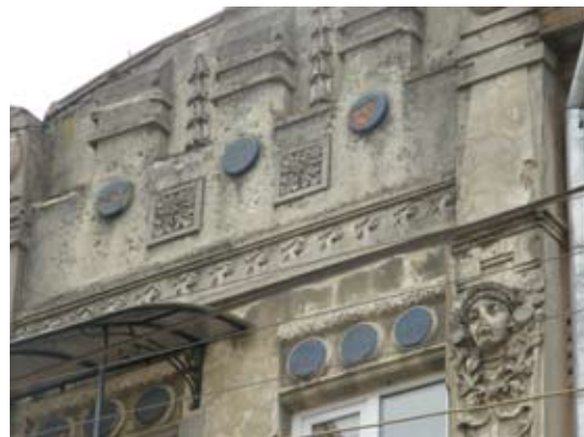
Вул. Нечуя-Левицького, 11-а