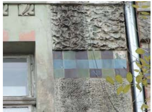
Вул. Донцова, 12