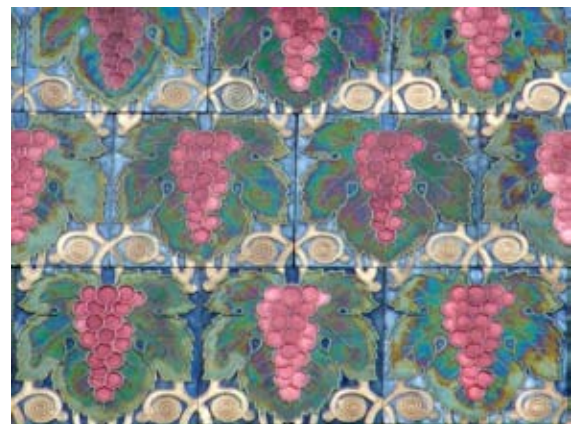
Вул. Тарнавського, 6–8