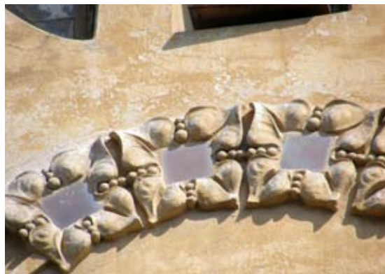
Вул. акад. Богомольця, 3