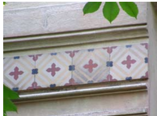
8 – вул. Вишенького, 30

Іл. 6. Форма майолікових дзеркал на сецесійних фасадах: 1 – прямокутна горизонтальна; 2 – прямокутна вертикальна; 3 – квадратна; 4 – Т-подібна; 5 – П-подібна; 6 – трикутна сходячча; 7 – півкругла; 8 – фризоподібна