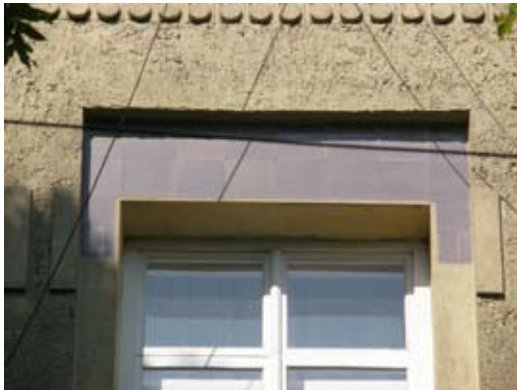
5 – вул. Донцова, 6