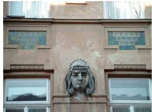
4 – вул. Тарнавського, 6–8