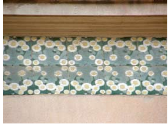
Вул. Бр. Рогатинців, 39