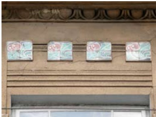
3 – вул. акад. Павлова, 1