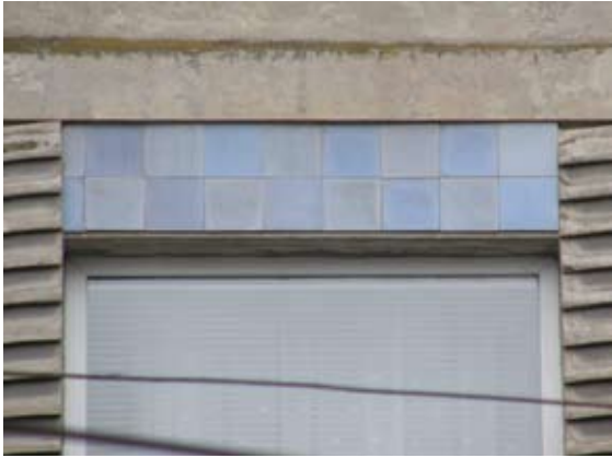
Вул. Руставелі, 44 (нюанс)