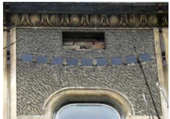
Вул. Менделєєва, 6