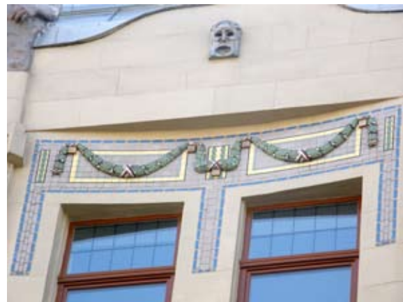
Вул. Коперника, 3