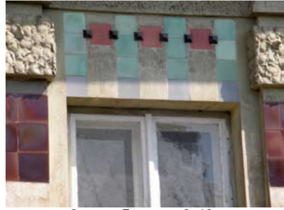
2 – вул. Донцова, 8–10