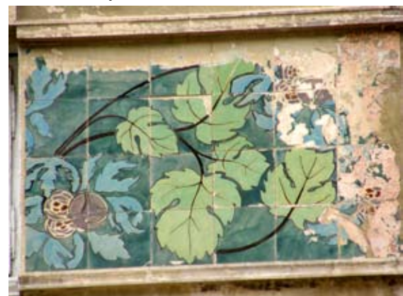
Вул. Богуна, 5