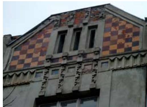
Вул. Донцова, 12 (контраст)