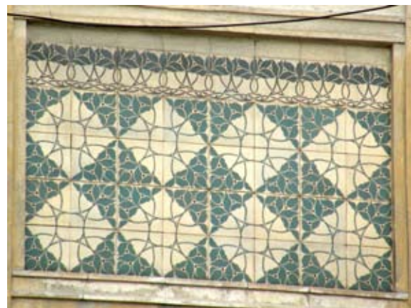
Вул. Руставелі, 8–8-а (1908 р.)