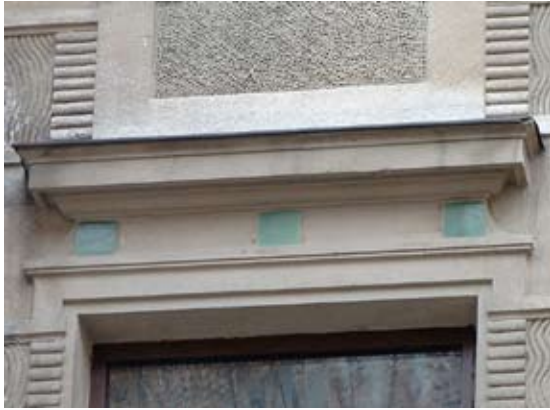
Вул. акад. Богомольця, 4