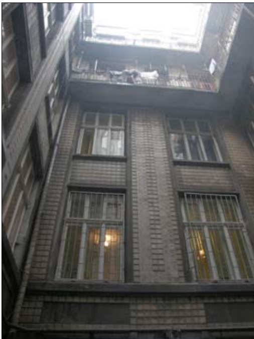
5 – вул. Галицька, 21 (подвір'я)