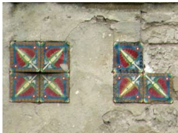
Вул. Долинського, 10–11