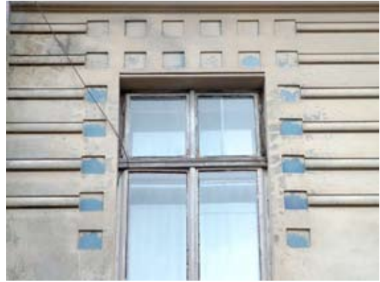
Вул. Донцова, 14