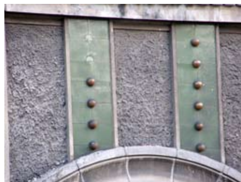
Вул. Котляревського, 25