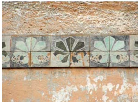
Вул. Шептицьких, 41 (1910 р.)