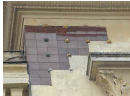
6 – вул. Кубійовича, 49