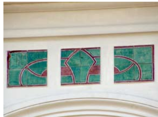
Вул. акад. Богомольця, 6