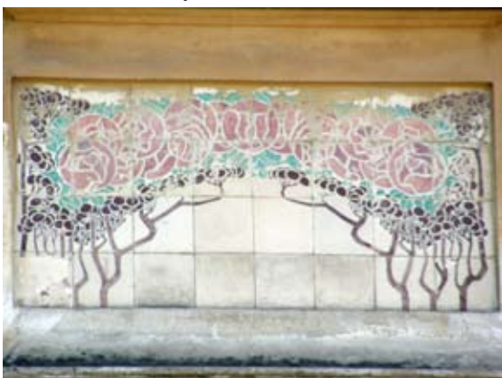
Вул. Личаківська, 70