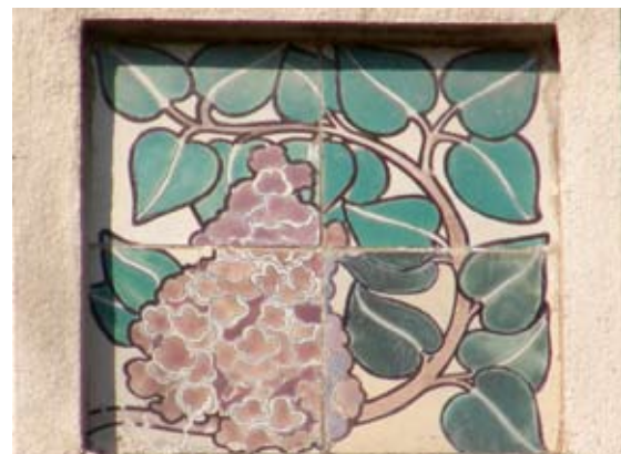
Вул. Наливайка, 9