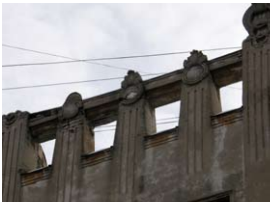
Вул. Дорошенка, 15 (майоліка зруйнована)