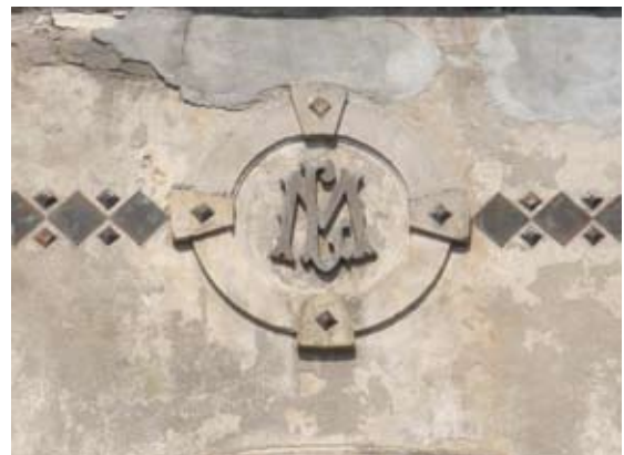
Вул. Хмельницького, 171