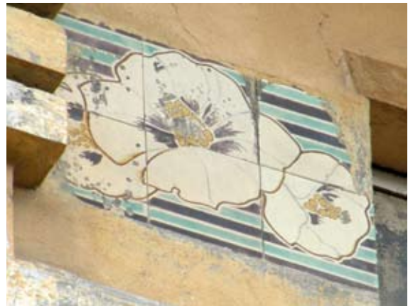
Вул. акад. Павлова, 3