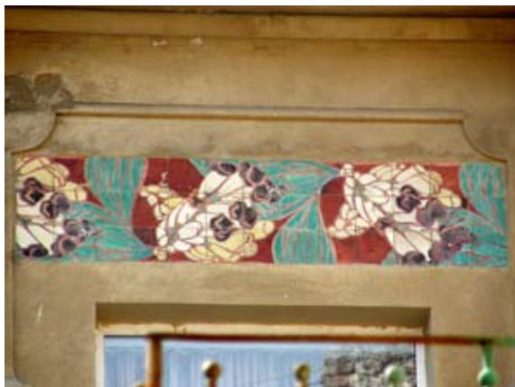
Вул. акад. Богомольця, 4 (1906 р.)