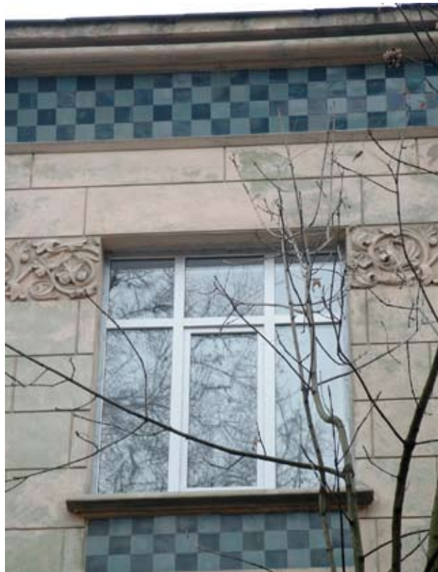
Вул. Богуна, 7 (контраст)