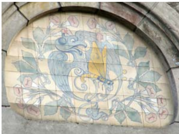
Вул. Наливайка, 9