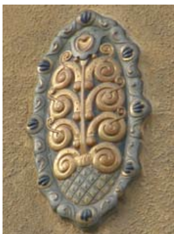
Іл. 1. Майолікові медальйони на фасадах орнаментальної сецесії