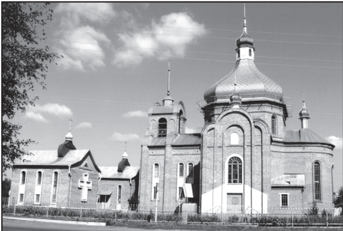
Церква 2000-ліття Різдва Христового

Франсуа Блондель-молодший, теоретик французької архітектури XVIII ст., сказав: "Задоволення, яке ми відчуваємо від прекрасного витвору мистецтва, залежить