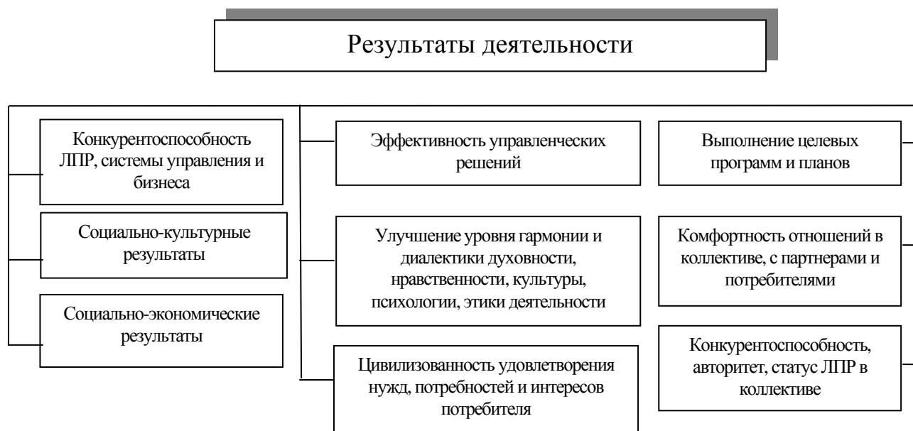
Рис. 2. Результаты деятельности от реализации ресурсоэкономных путей повышения эффективности управленческих решений

Социально-этические факторы производства составляют основу деловой культуры организации, под которой понимаются принятые руководством организации и поддерживаемые персоналом духовные ценности. Деловая культура касается не только внутренней жизни коллектива, фактически она формирует и внешнюю среду организации через комфортность в отношении с потребителями, партнерами, заказчиками и т.д. Деловая культура организации проявляется в поведении сотрудников, в их восприятии себя, организации в целом и окружающей среды. Центральное место в организационной культуре занимает набор ценностей, т. е. официально принятый в организации набор наиболее значимых и неизменных принципов, на которых основывается поведение руководителя, коллектива и отдельного работника. Обеспечение и развитие высоких социально-этических и нравственно-моральных отношений в коллективе предопределяет эффективное функционирование организации, уменьшение затрат и экономию ресурсного потенциала предприятия (рис. 2).