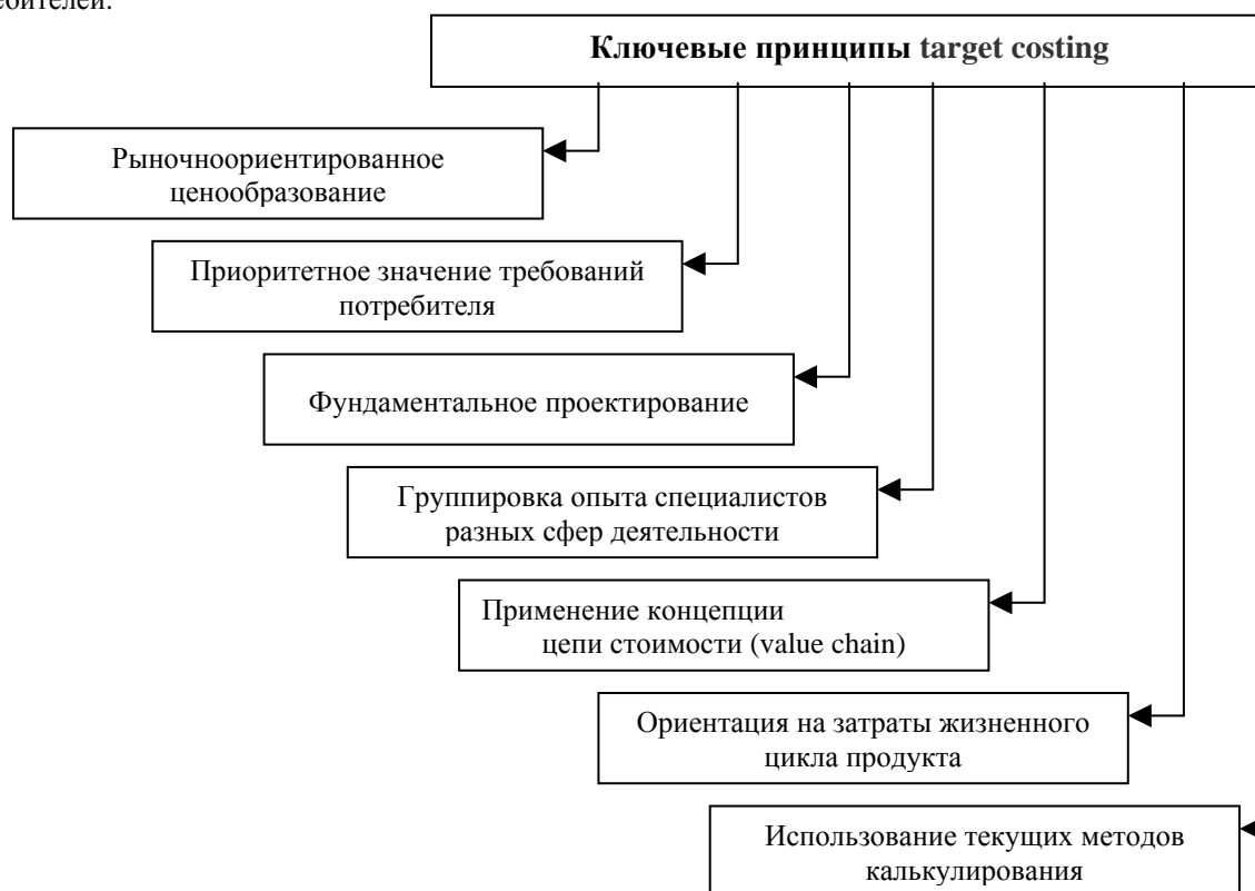
Рис.1. Ключевые принципы target costing

Метод target costing основывается на следующих принципах см. рис. 1. Приведенные принципы на рис.1 показывают, что данный метод направлен на формирование активной среды целевого планирования затрат и прибыли, предвидит определение себестоимости новой продукции исходя из прогноза рыночных цен, объемов реализации и установленной нормы прибыли, а так же из приоритетного значения требований потребителей.