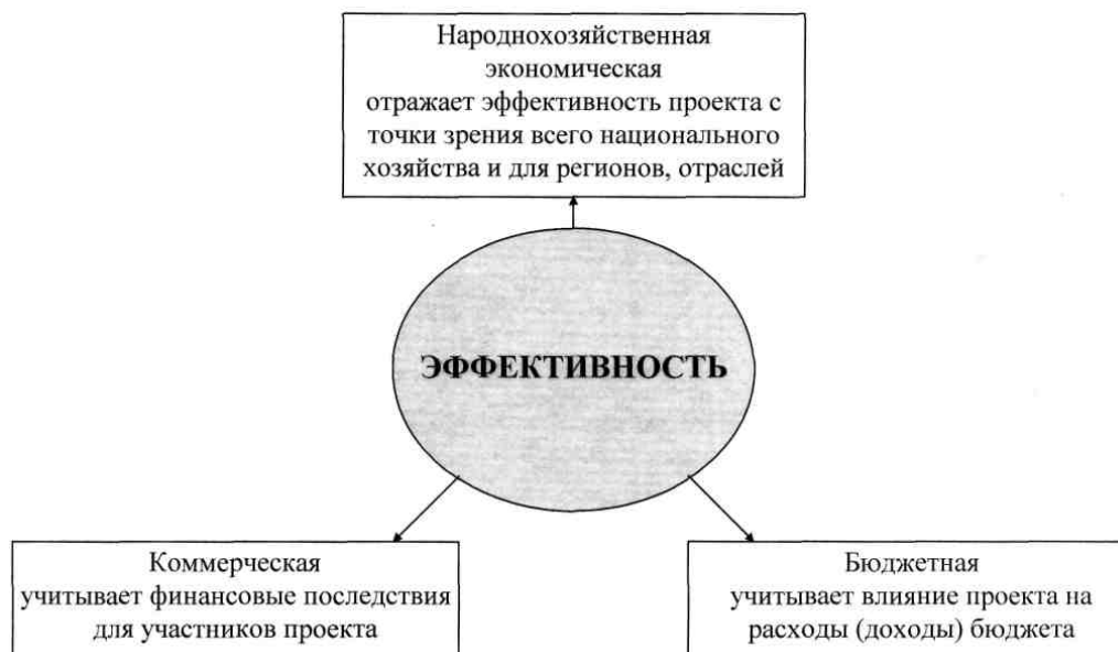
Рис. 3. Показатели эффективности инновационного проекта

тий используются показатели сравнительной экономической эффективности, которые учитывают лишь изменяющиеся по сравниваемым вариантам стоимостные части.