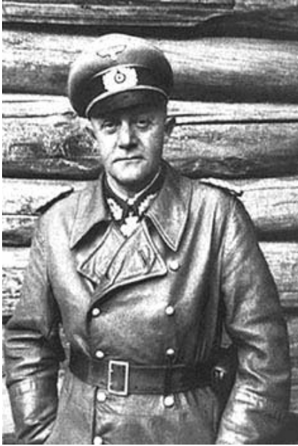
Генерал Лаш на Східному фронті. Фото 1943 р.

Із серпня 1941 р. 217-та дивізія воювала у складі 18-ї армії на островах Моозунзундського архіпелагу (північний захід Ризької затоки), що мали важливе значення для