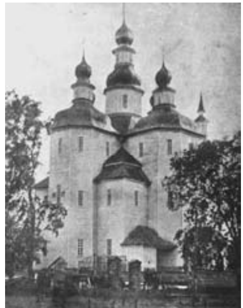
Вознесенська церква у Березні (1761) Фото поч. XX ст.