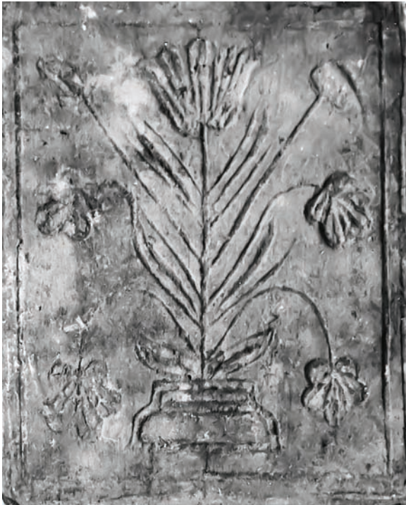
Іл. 6. Кахля лицьова. Глина, тиснення у формі. с. Кунцеве Новосанжарського р-ну Полтавської обл. Кінець XIX ст. НМНАПУ. Інв. № КС-4528. Світлина В. Савича