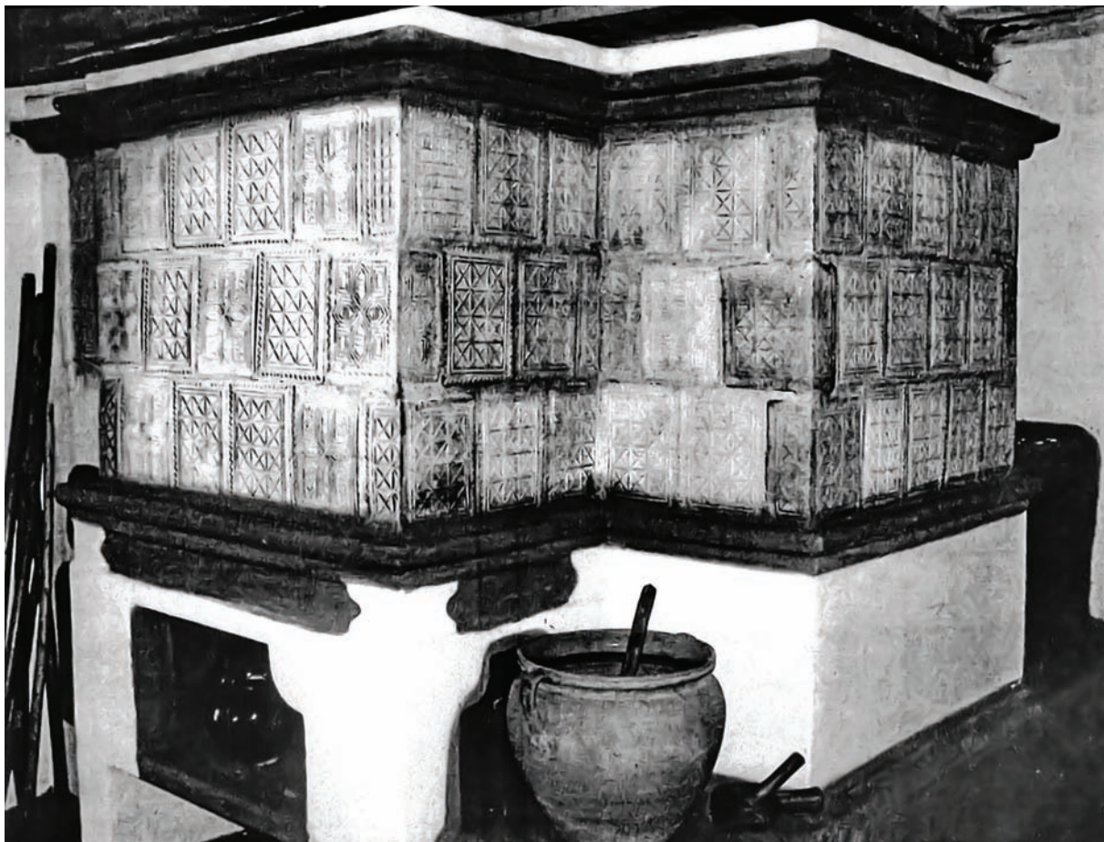
Іл. 5. Кахляна піч. с. Лелюхівка Новосанжарського р-ну Полтавської обл. Друга половина XIX – початок XX ст. НМНАПУ, експозиція.

Під час експедиційного обстеження м. Миргорода та прилеглих сіл було знайде-