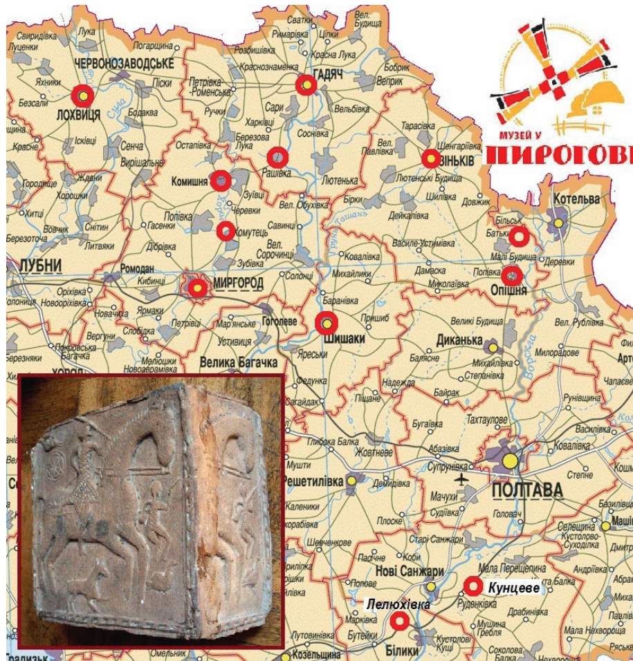
Іл. 1. Карта обстежених науковцями НМНАПУ осередків кахлярства Полтавщини.

ної кераміки XVI – першої половини XX століть», у якому авторка згадує кахлі зі збірки НМНАПУ (інв. № КС-4828, КС-5194, НД-2317) (іл. 2, 4).