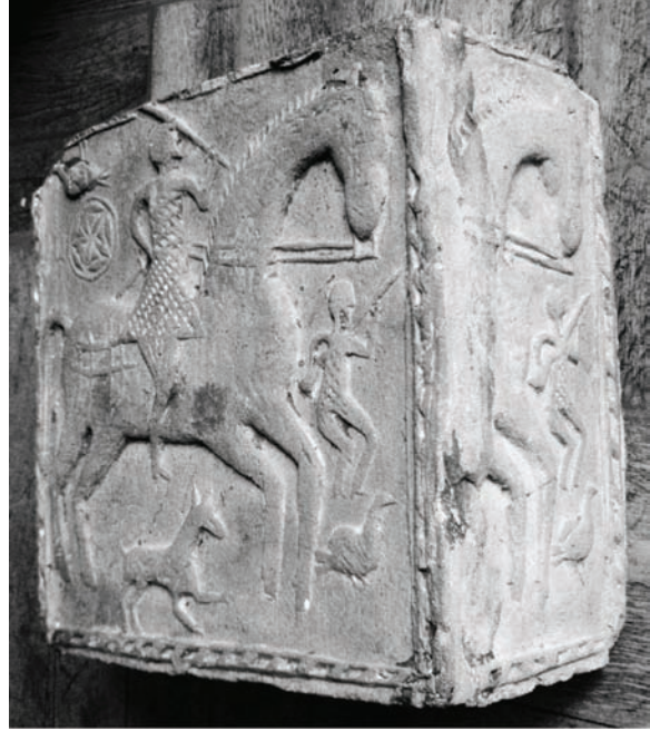
Іл. 9. Кахля кутова. Глина, тиснення у формі. Полтавська обл. Кінець XVII ст. (?). НМНАПУ. Інв. № КС-6971.

Підсумовуючи величезну роботу, яку провели науковці НМНАПУ для створення колекції неполив'яних кахель Полтавщини, можна сказати, що ця збірка є вагомим внеском у загальну музейну та культурну спадщину України. Процес формування колекції триває і надалі, хоча дедалі менше можна віднайти такі примірники кахлярства, якими володіє Музей, у сучасних селах Полтавщини. Цінність зібраної колекції не викликає сумніву в дослідників, які вже частково висвітлювали її у своїх працях і далі опрацьовуватимуть величезний фактичний та інформативний матеріал, накопичений у запасниках Музею. Традиційні рельєфні кахлі з музейної збірки НМНАПУ — безмежний