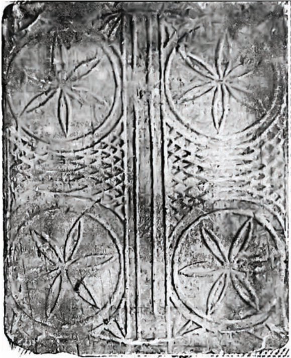
Іл. 4. Кахля лицьова. Глина, тиснення у формі. с. Хомутець Миргородського р-ну Полтавської обл. Кінець XIX ст. НМНАПУ. Інв. № КС-5194.

но хвилясті стебла з листям, угорі над вазоном — ще одна велика квітка. Саме цю кахлю 2007 року вперше в літературі опублікувала у своїй праці «Декор української народної кераміки XVI — першої половини XX століть» Г. Івашків [1, с. 272] (іл. 6).