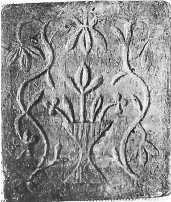
Іл. 2. Кахля лицьова. Глина, тиснення у формі. с. Рашівка Гадяцького р-ну Полтавської обл. Друга половина XIX ст. НМНАПУ. Інв. № КС-4828.

У 1979 році колекція Музею поповнилася 23 кахлями із сіл Забрідки, Кунцеве, Ключівка, Зачепилівка Новосанжарського району Полтавської області (інв. № КС-4498—4517). Усі вони орнаментовані ромбами, заведеними в чотирикутну рамку, датуються кінцем XIX ст. Цікавий декор має кахля із с. Кунцеве (інв. № КС-4528). Цінність такої кахлі в колекції НМНАПУ визначається особливим відтиском узору. Прикрашена вона вазоном із трьома квітками, по боках якого розташова-