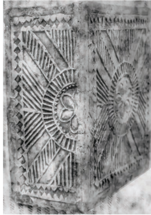
Іл. 7. Кахля кутова. Глина, тиснення у формі. с. Кунцеве Новосанжарського р-ну Полтавської обл. Кінець XIX ст. НМНАПУ. Інв. № КС-5169.

но ще три неполив'яні рельєфні кахлі. Дві кахлі із цієї експедиції (інв. № НД-20806, НД-20807) мають такі мотиви рельєфного орнаменту: скісний хрест і чотири розетки між його раменами, шестипелюсткова квітка, заведена в коло. Третя кахля — кутова, її лицьову й бокову частини оздоблено рельєфом «сосна» (інв. № НД-20808). Усі три кахлі датовані кінцем XIX ст. У 1997 році до колекції неполив'яних кахель Полтавщини надійшло три кахлі із с. Галі Кобеляцького району Полтавської області. Кахлі, імовірно, походять із відомого центру кахлярства — смт Опішне Зінківського району Полтавської області, оскільки мають типове для цього осередку зубчасте обрамлення площини центрального поля. Кахлі цієї експедиції (інв. № НД-21960) орнаментовані чотирма розетками, між ними в центрі — ромб із хрестом. Інша кахля (інв. № НД-21961) оздоблена двома рядами рослинного орнамен-