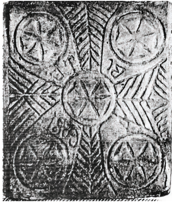
Іл. 3. Кахля лицьова. Глина, тиснення у формі. с. Рашівка Гадяцького р-ну Полтавської обл. Друга половина XIX ст. НМНАПУ. Інв. № КС-6127.