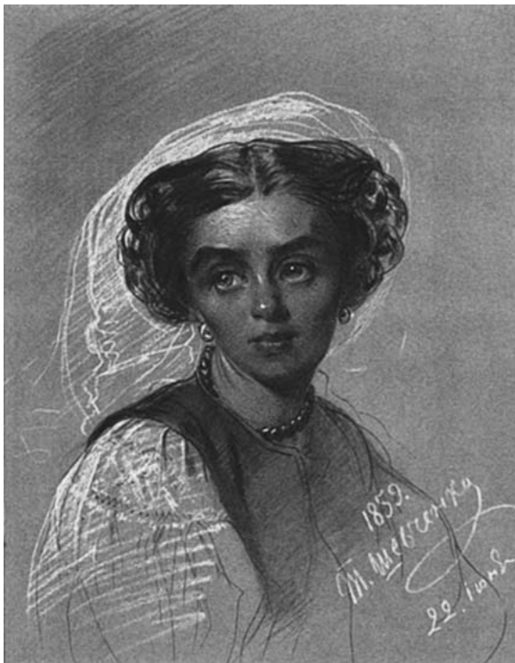
Т. Шевченко. Портрет М. В. Максимович. Італійський олівець, крейда. 1859

світу. Ще вони символізують засіяне поле і жіноче начало (на відміну від чоловічого — кола). Трикутники — символ тріади, Святої Трійці. Вишивальниця свідомо чи підсвідомо використовувала давні символи. У семантиці вишиванки відбилися ідеали краси, образне мислення майстринь, а також оберегове, охоронне начало. Складна мова орнаменту в українській вишивці не має жодної зайвої лінії, кожна рисочка вмотивована, несе певне навантаження.