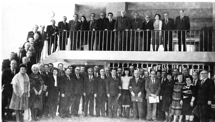
Київ, Феофанія, нарада голів ВАК СРСР (1984 р.).