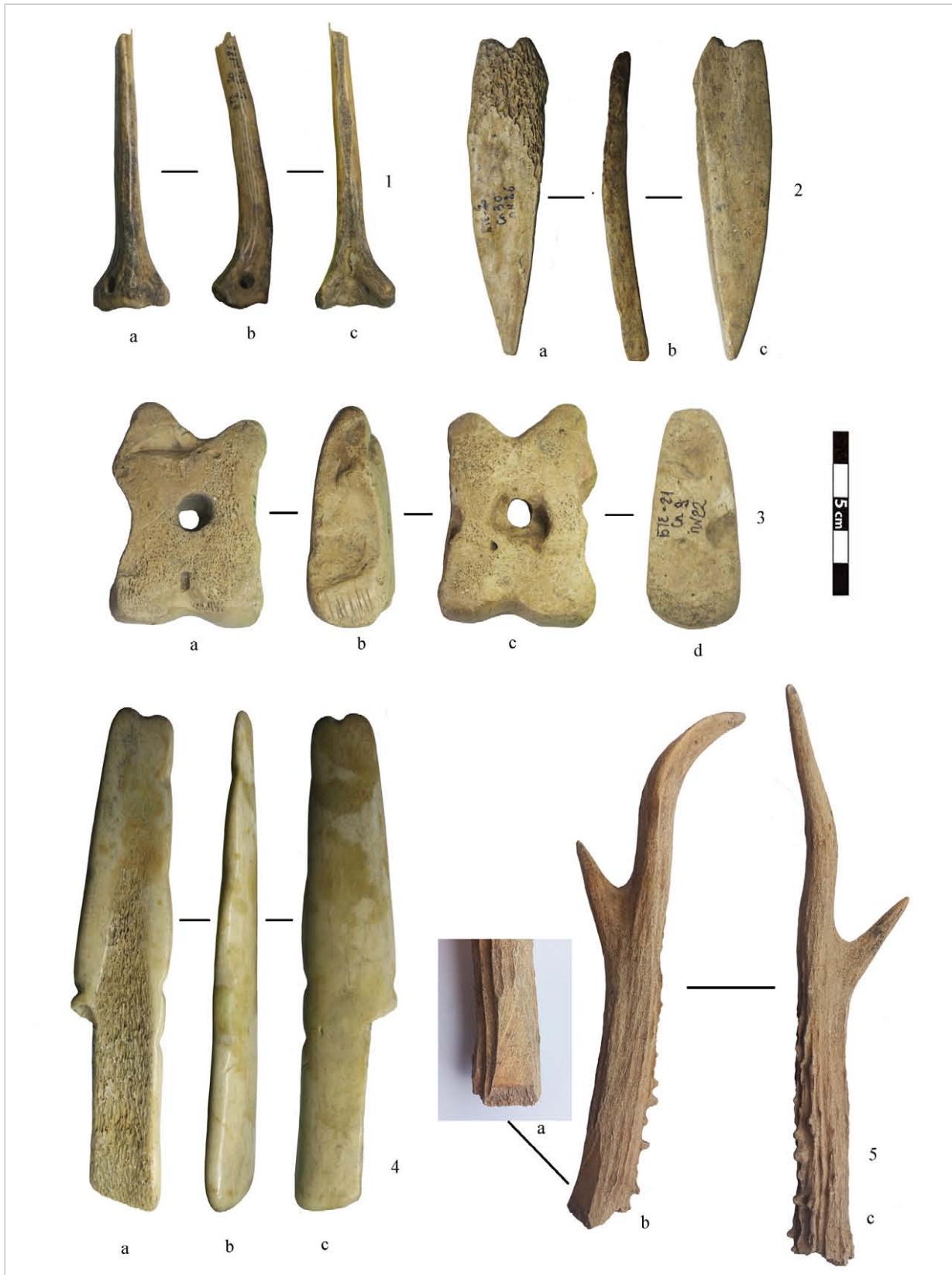
Рис. 3. Кістяні та рогові вироби: 1 — знаряддя з грудного плавця риби; 2 — знаряддя; 3 — підшипник (?); 4 — тріпало (?); 5 — виріб із рога. (1–4 — Фото Н. Петрової; 5 — фото О. Савельєва) Fig. 3. Bone and horn objects: 1 — a tool made from the pectoral fin of a fish; 2 — a tool; 3 — a bearing (?); 4 — fluttered (?); 5 — a horn item (1–4 — photo by N. Petrova; 5 — photo by O. Saveliev)