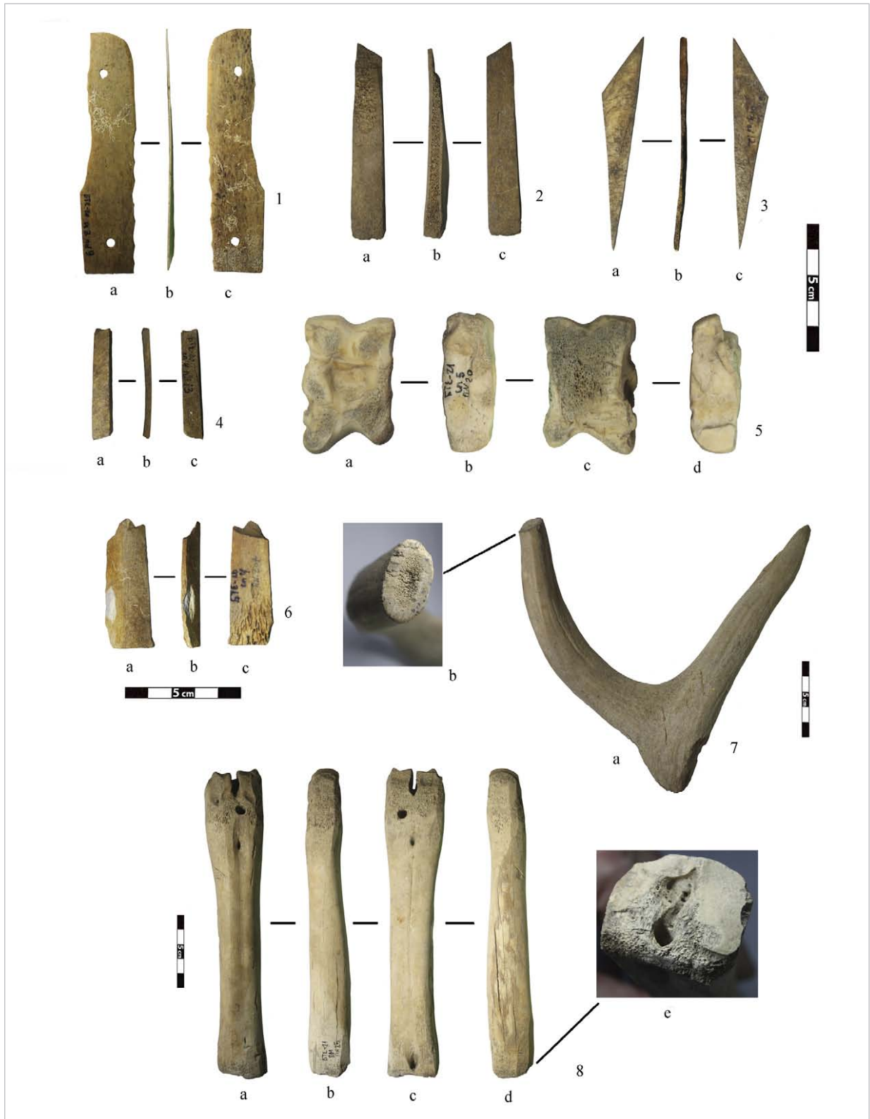
Рис. 4. Кістяні та рогові вироби: 1 — облицювальна пластина; 2 — заготовка (?); 3 — відхід виробництва (?); 4 — заготовка або відхід виробництва; 5 — заготовка (?); 6 — пластина-заготовка; 7 — фрагмент рога оленя; 8 — знаряддя.