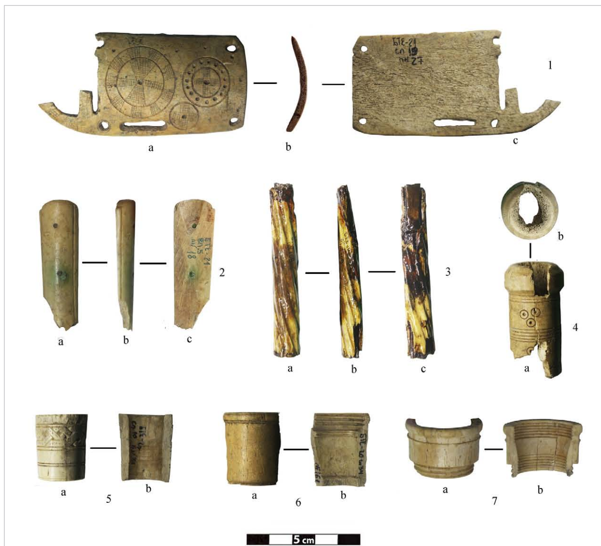
Рис. 1. Кістяні вироби: 1 — пряжка; 2—3 — фрагменти руків'їв ножів; 4—7 — деталі мундштуків (?). Fig. 1. Bone objects: 1 — a buckle; 2—3 — fragments of knife handles; 4—7 — details of mouthpieces (?).

Розміри: довжина — 2,8 см, ширина (діаметр) — 2,3 см, товщина стінок — 0,4 см.