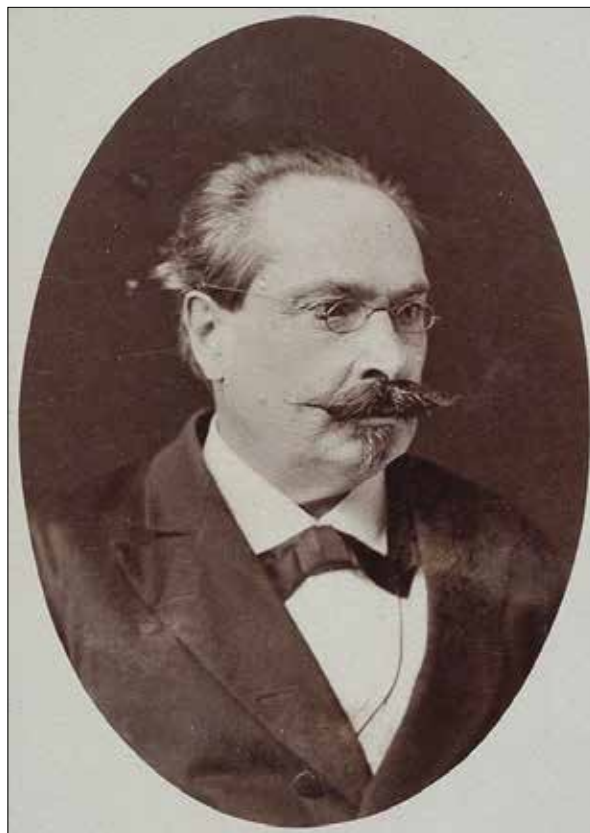
Рис. 1. Адам Кіркор (1818—1886) (за: Булик 2020, рис. 4) Fig. 1. Adam Kirkor (1818—1886) (after: Булик 2020, fig. 4)

Серед відкритих пам'яток були й такі, які містили розписний посуд. А. Кіркор відніс їх до культури «язичницького» часу, проте не дав їй назви. Сьогодні ці пункти відомі як трипільські, їх ми розглянемо детальніше. З огляду на усталену термінологію, саме трипільськими ми називаємо ці пам'ятки у тексті.