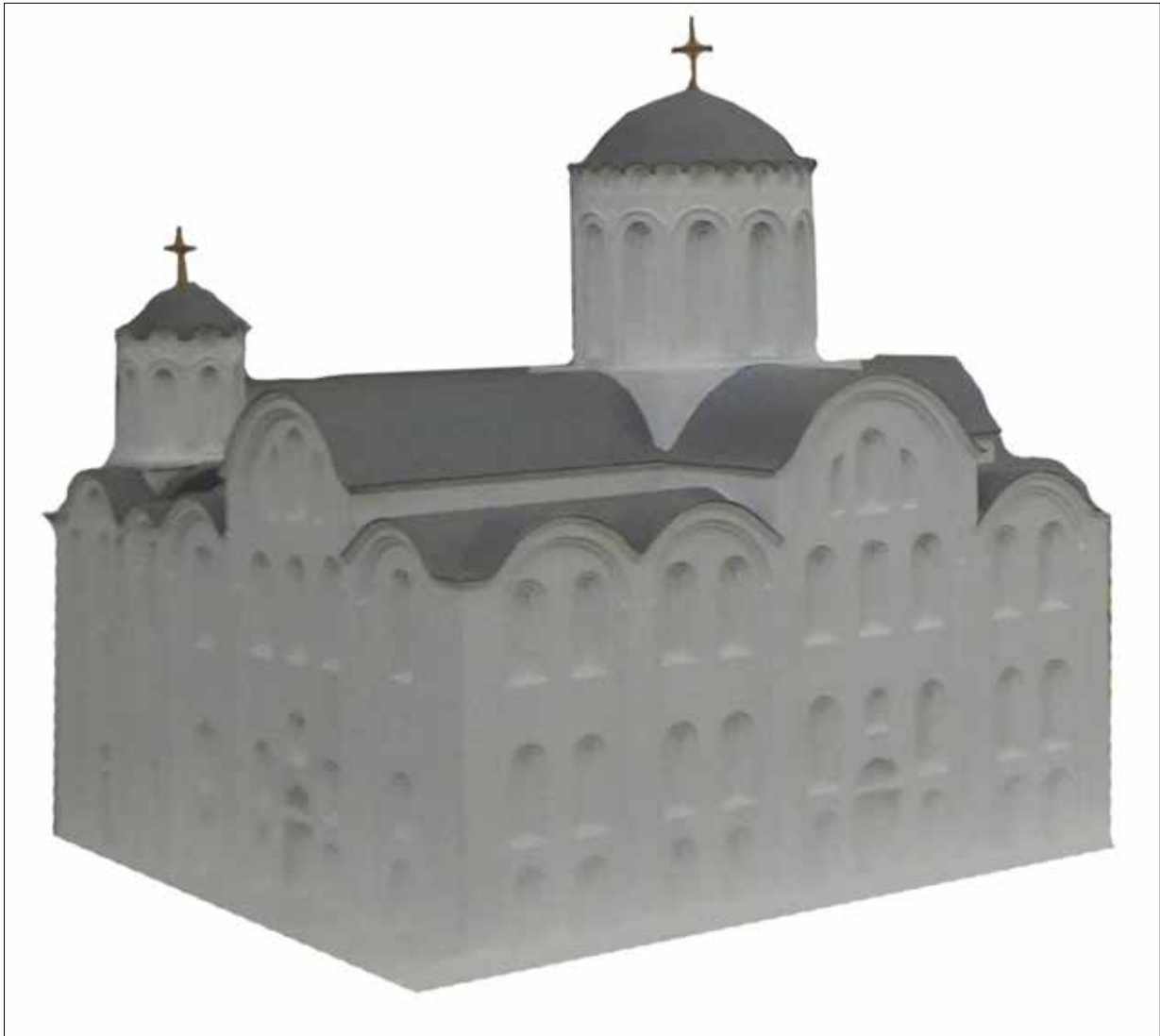
Рис. 6. Макет Успенського собору Києво-Печерської лаври XI ст. Реконструкція М. В. Холостенка (Національний заповідник «Києво-Печерська лавра», інв. № КПЛ-СК-НДФ-30)