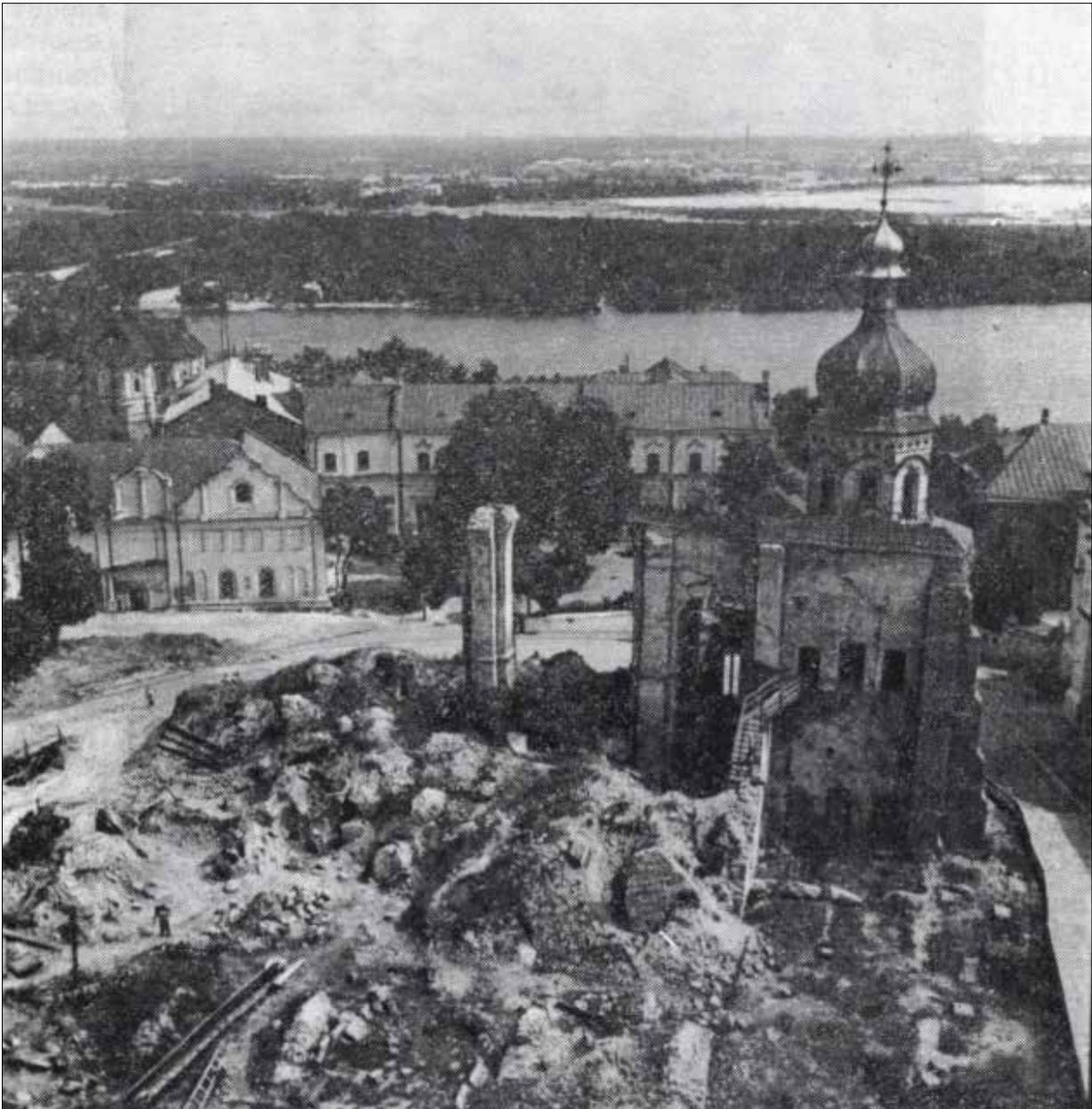
Рис. 4. Руїни собору, фото 1956 р. (за: Холостенко 1975, рис. 2)