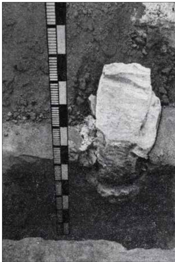
Рис. 5. «Камінь основи» (за: Холостенко 1975, рис. 20)

Матеріали, виявлені під час досліджень, надали Миколі В'ячеславовичу інформацію для реконструкції архітектурної історії собору. З'ясовано, що до структури південної стіни