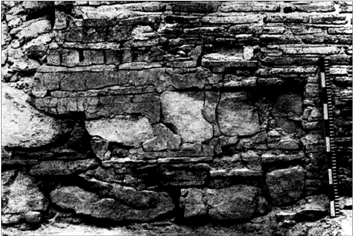
Рис. 3. Частина південної стіни Успенського собору (ліворуч — мурування XI ст., праворуч — кладка XIII ст.) (за: Холостенко 1955, рис. 10)