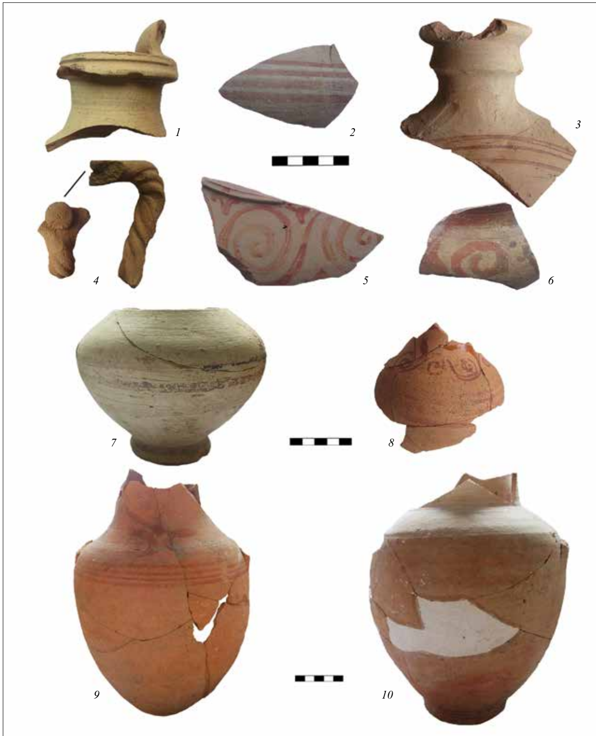
Рис. 1. Елліністична кераміка з Ольвії: 1 — вінця глека (О-67/573); 2 — стінка глека зі смугастим орнаментом (О-65/421); 3 — фрагмент фляги (АГД/О-72/181/2); 4 — ручка глека з наліпом (О-56/4490); 5, 6 — стінки глеків із рослинним орнаментом (О-66/857; О-64/1846); 7 — частина глека малих розмірів зі смугастим орнаментом (О-63/1193); 8 — частина глека малих розмірів із рослинним орнаментом (О-71/806); 9, 10 — орнаментовані глеки великих розмірів (АГД/О-74/457; АГД/О-75/144)

Fig. 1. Hellenistic ceramics from Olbia: 1 — a rim of the jug (O-67/573); 2 — a wall of the jug with a striped ornament (O-65/421); 3 — a fragment of the flask (АГД/О-72/181/2); 4 — a handle of the jug with a convex part in the shape of a flat circle (O-56/4490); 5—6 — walls of jugs with floral ornaments (O-66/857; O-64/1846); 7 — a part of the small jug with a striped ornament (O-63/1193); 8 — a part of the small jug with floral ornament (O-71/806); 9, 10 — ornamented large jugs (АГД/О-74/457; АГД/О-75/144)