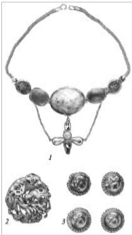
Рис. 1. Ювелірні прикраси, що, ймовірно, походять із грабіжницьких розкопок пізньоскіфських могильників Криму, поховань Північного Причорномор'я чи Прикубання. За матеріалами аукціонних каталогів Christie's і Sotheby's-2003. 1 — лот 445; 2 — лот 150; 3 — лот 382

на користь фальсифікації якого є пристрій голкового апарата. Фібула на звороті брошки не зовсім точно копіює голковий апарат, що з'явився не раніше I ст. до н. е. (Шелов 1961, табл. XXXIX, 9). Чотиривиткову пружину з голкою припаяно до краю виробу з обороту, до іншого ж краю припаяно приймач, а спинка відсутня (Стоянов 2004, с. 96; Стоянов 2004а, с. 462, рис. 2, «реверс»). Таке сполучення ознак не має прецеденту в пам'ятках античного часу. Пружину взагалі не можна безпосередньо припаявати до корпусу брошки, оскільки в цьому випадку голковий апарат буде недовговічним — він не розрахований на навантаження. Римські пружинні брошки, на які, очевидно, орієнтувався майстер, зроблено інакше (Riha 1994, taf. 8, gruppe 3, typ. 15, 16, 19—23; taf. 41, gruppe 7, typ. 8, 10).