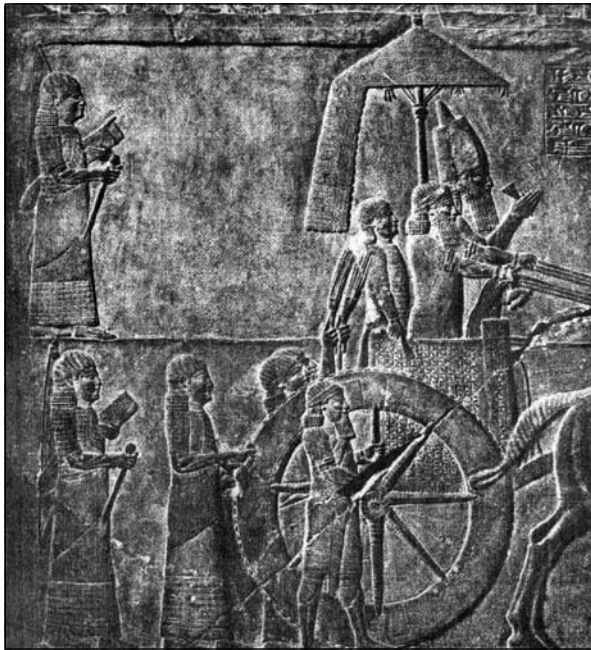
Рис. 1. Рельєф Ашшурбаніпала (за J. Potratz)