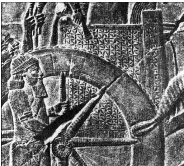
Рис. 2. Рельєф Ашшурбаніпала, фрагмент (за J. Potratz)

зу дещо звужується. Вона прикрашена одним вертикальним рядом розділених навпіл квадратиків, причому у верхній частині смуги, через її розширення, зроблено спробу переходу до двох рядів квадратиків. Проте до смуги увійшла лише їхня центральна частина, так що загалом виникає враження розетки (рис. 1; 2).