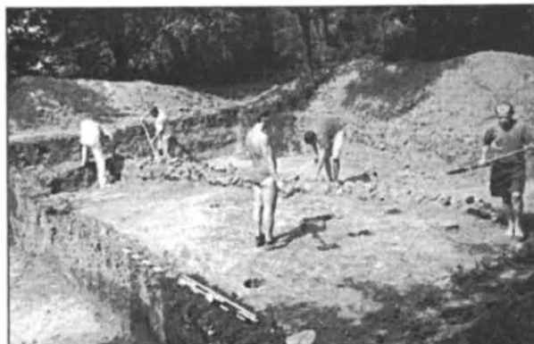
Підготовка демонстраційного розкопу на городищі № 3 літописного Іскоростеня

Учасники і гості конференції оглянули виставку-експозицію, розгорнуту у краєзнавчому музеї м. Коростеня. На ній були представлені численні артефакти VI—XVII ст., здобуті під час археологічних розкопок городищ літописного Іскоростеня експедицією АІ НАНУ у 2001—2004 рр. Крім