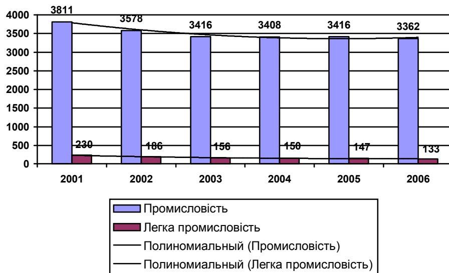
Рис. 2. Середньорічна кількість найманих працівників у 2001-2006 рр. (тис. осіб).

Що стосується оплати праці найманих працівників легкої промисловості, то тут вона майже вдвічі відстає від заробітної плати у промисловості. Якщо у промисловості у 2006 р. середньорічна номінальна заробітна плата складала 1212 грн., то у легкій промисловості лише 653 грн., що видно з рис. 3 [8, С. 393].