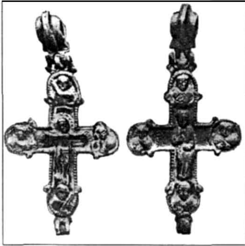
Рис. 1. Хрест-енколпiон зi Старокiївської гори у Києві (початок XIII ст.)

Адже тiльки в такому разi можливо, не дивлячись поверх голiв, належно опрацювати знахiдки, коли ще не забулися тi численнi подробицi з умов пошукiв, якi майже не потрапляють до звiтiв.