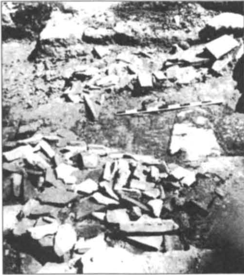
Рис. 3. Залишки дахівок на підлозі приміщення терм на території римської цитаделі Херсонеса. Розкопки І.А. Антонової