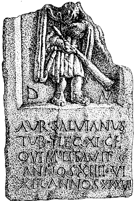
Рис. 2. Надгробок Аврелія Сальвіана — сурмача XI Клавдієвого легіону з Херсонеса