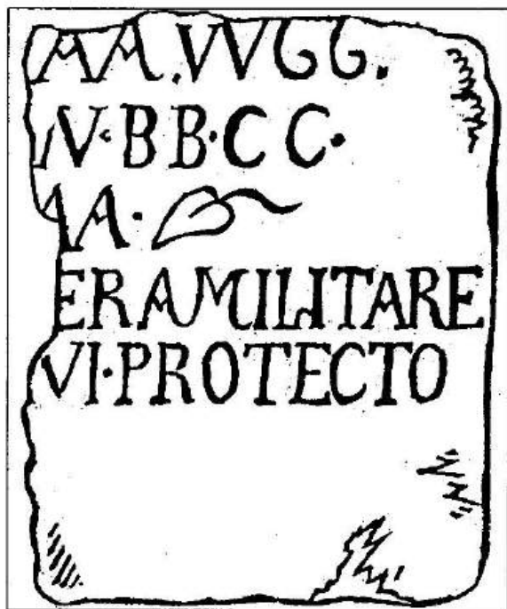
Рис. 2. Фрагментований напис з згадкою протектора за П. С. Палласом та Е. І. Соломоник.

клетіана і Констанція I (305—306 рр.) зі співправителями (293—305 або 305—306 рр.) 28 .