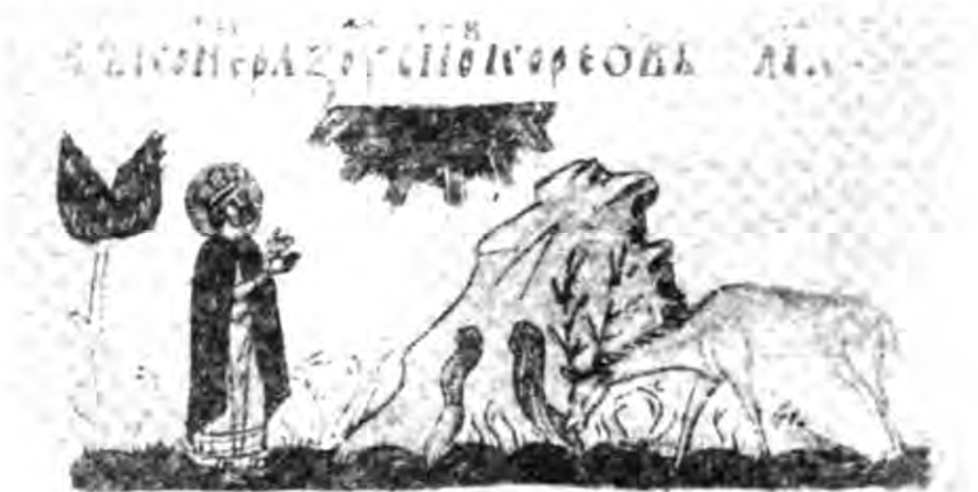
Рис. 4. Паралелі Бушанського рельєфу:

1 — скельний рельєф Святого Онуфрія з села Кашперівці Заліщицького району Тернопільської області; 2 — болгарська мініатюра XIV ст.