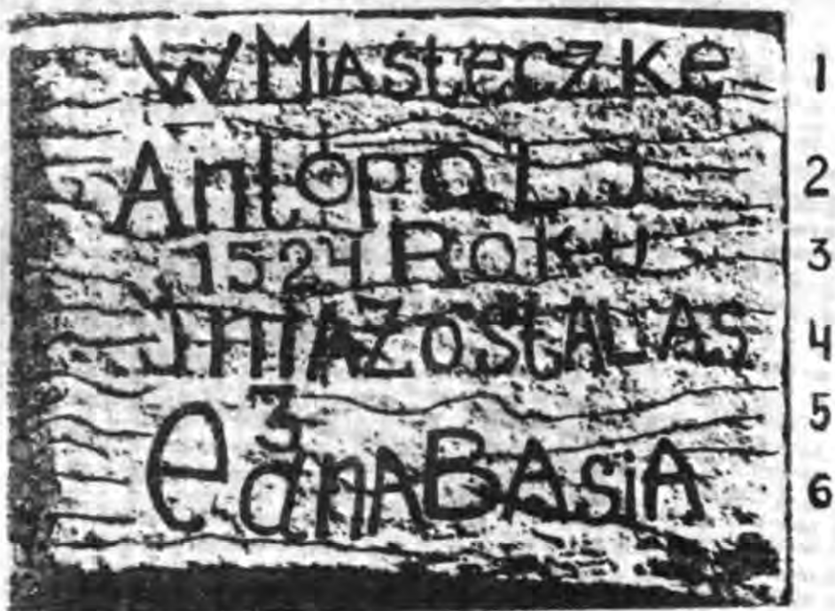
Рис. 2. Рамка зі слідами напису, елемент композиції рельєфу до і після реконструкції напису (збільшення з фотографії 1883 р.).

вається бушанцями — «Татарська». Згадується ця назва Л. Марчинським і в 1822 р. 12 Поселення, що виникло пізніше, почало називатись «Буша — бо ж залишилась одна душа». Згадуючи цей вислів, мешканці села не пояснюють його — такою непрозорою, незрозумілою, загадковою здається їм зараз назва села. Очевидно, чули цей вислів і в 1873 році, хоч зміст розуміли інакше: «По преданню, на той написи и возле нея, на мѣстѣ нынѣ существующего с. Буши, нѣкогда стояло многолюдное и богатое мѣстечко, называющееся Гилополемъ или Антополемъ. Нынѣшнее с. Буша произошло отъ этого мѣстечка и названо такъ отъ малороссійскаго слова «бушовать» потому, что здѣсь кто-то когда-то бушевалъ, — вырѣзалъ всё населѣніе мѣстечка» 13 .