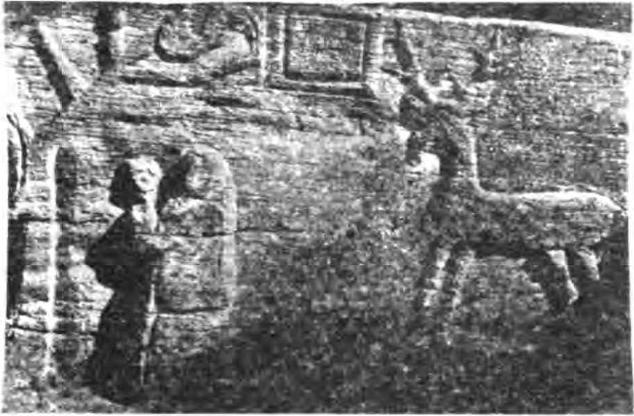
Рис. 1. Наскальний рельєф з села Буша Ямпільського району Вінницької області (відбиток з фотографії В. Б. Антоновича, 1883 р.).