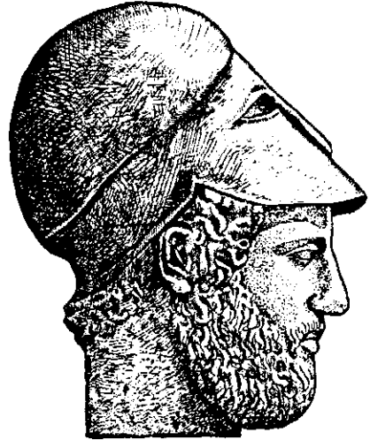
Рис. 1. Перікл. Скульптурний портрет. V ст. до н. е.

В Ольвії демократизація знайшла своєрідне відображення і в надгробній скульптурі третьої чверті V ст. до н. е. Тут маються на увазі монументальні жіночі стели Фідієвської школи, завезені в Ольвію з Афін. На них вперше показано не покірливу залежність служниці-рабині від своєї господині, а тісну дружбу двох жінок. Німа розмова між ними засобами мистецьких прийомів повинна була символізувати горе зображеної на повний зріст служниці — «подруги», одяг і зачіска якої мало чим розрізнялися з тими, які були у померлої господині.