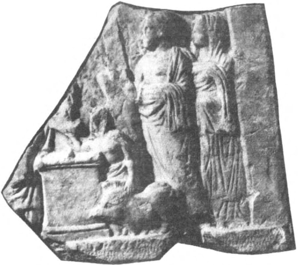
Рис. 2. Сцена жертвоприношення. Фрагмент вотивного рельєфу. III ст. до н. е.