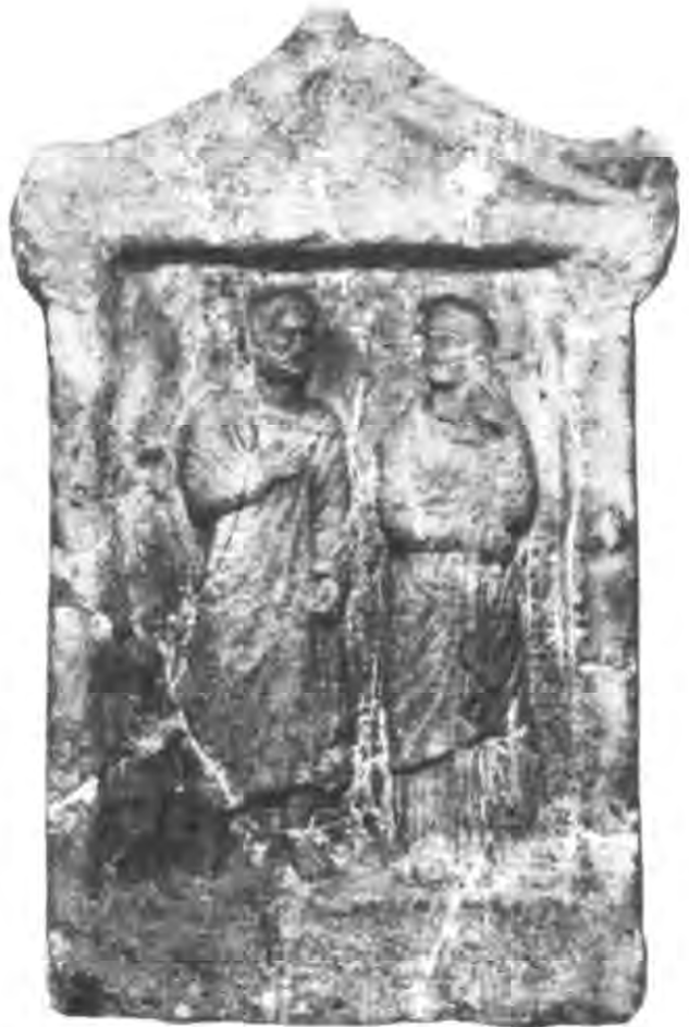
Рис. 4. Надгробна стела з зображенням ольвійської сім'ї та домашнього раба.

У демократичних полісах кожен державний діяч повинен був володіти