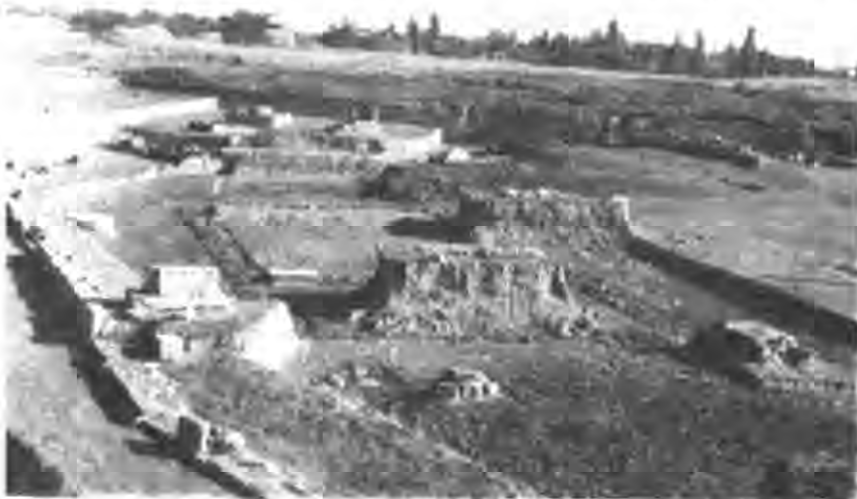
Рис. 5. Загальний вигляд західного теменосу Ольвії.

Загалом, як свідчить розгляд епіграфічних джерел, в Ольвії найбільше вираження знайшли другий і третій види демократії (за Арістотелем), тобто державні посади в основному обіймали громадяни за походженням, які володіли певними достатками і мали змогу виконувати громадські обов'язки.