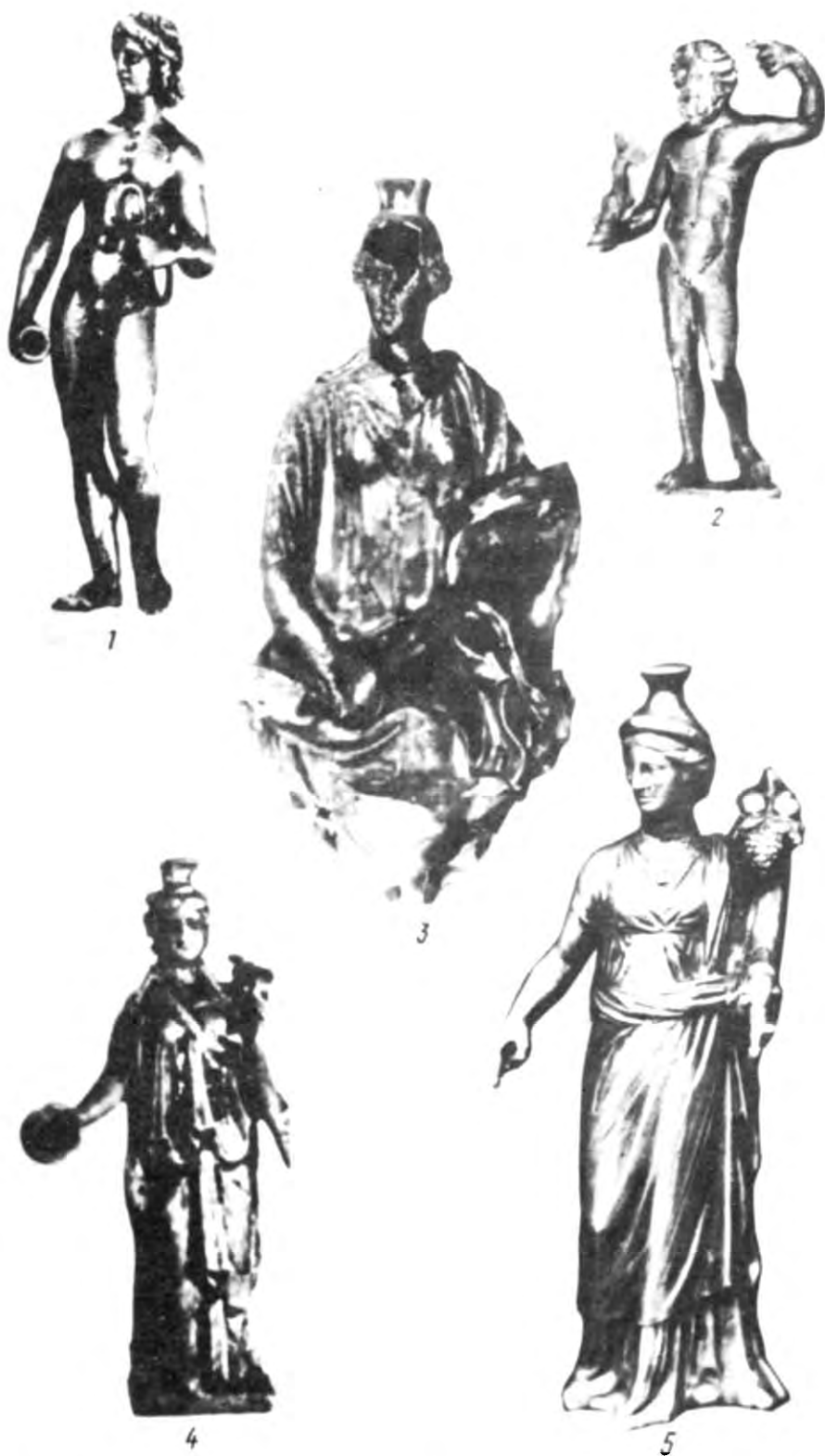
Рис. 4. Срібні статуєтки з розкопок святилища біля перевалу Гурзуфське Сідло. 1 — 3,5 — в натуральну величину; 4 — розміри збільшено вдвічі.