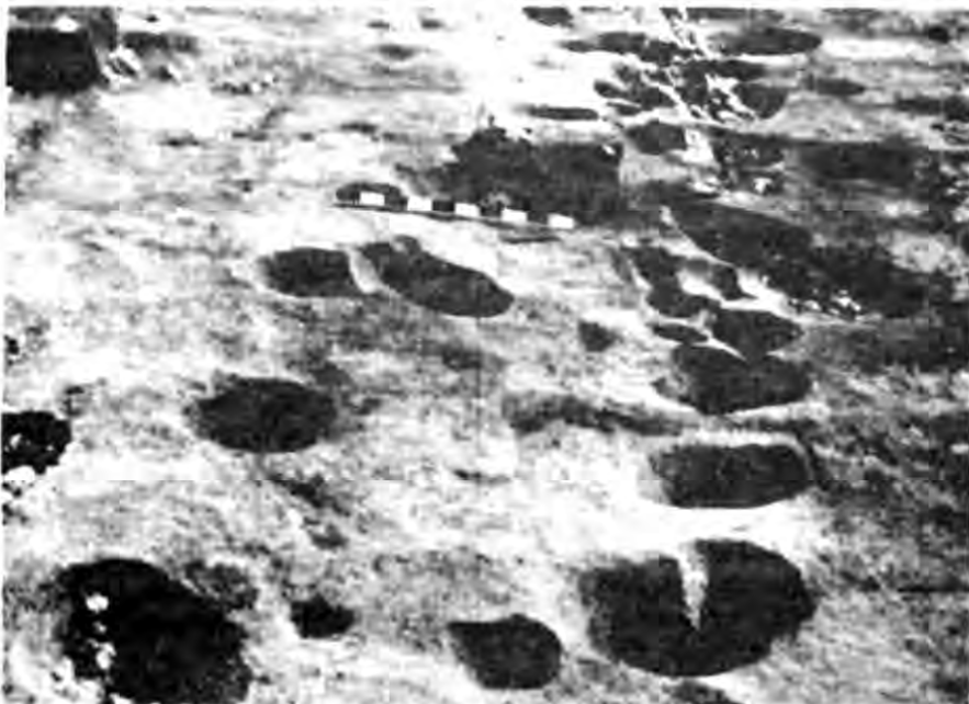
Рис. 2. Західна ділянка ритуального комплексу з огорожею із ямок. Вид з півночі.

Святилище даного періоду являло собою відкриту площадку, без будь-яких архітектурних споруд. Сакральний центр за формою наближався до неправильного широкого незамкненого овалу з нерівними обрисами, поздовжня вісь якого спрямована на північ — північний захід. Простір сакрального центру із заходу, півночі й сходу відділявся від решти території святилища подвійною лінією з розташованих по периметру ямок (рис. 2,3). Їх звичайний діаметр близько 0,2—0,4 м. Ямки доповнювались необробленим камінням, окремі екземпляри якого сягали 0,2—0,5 м у перетині. Розташування каме-