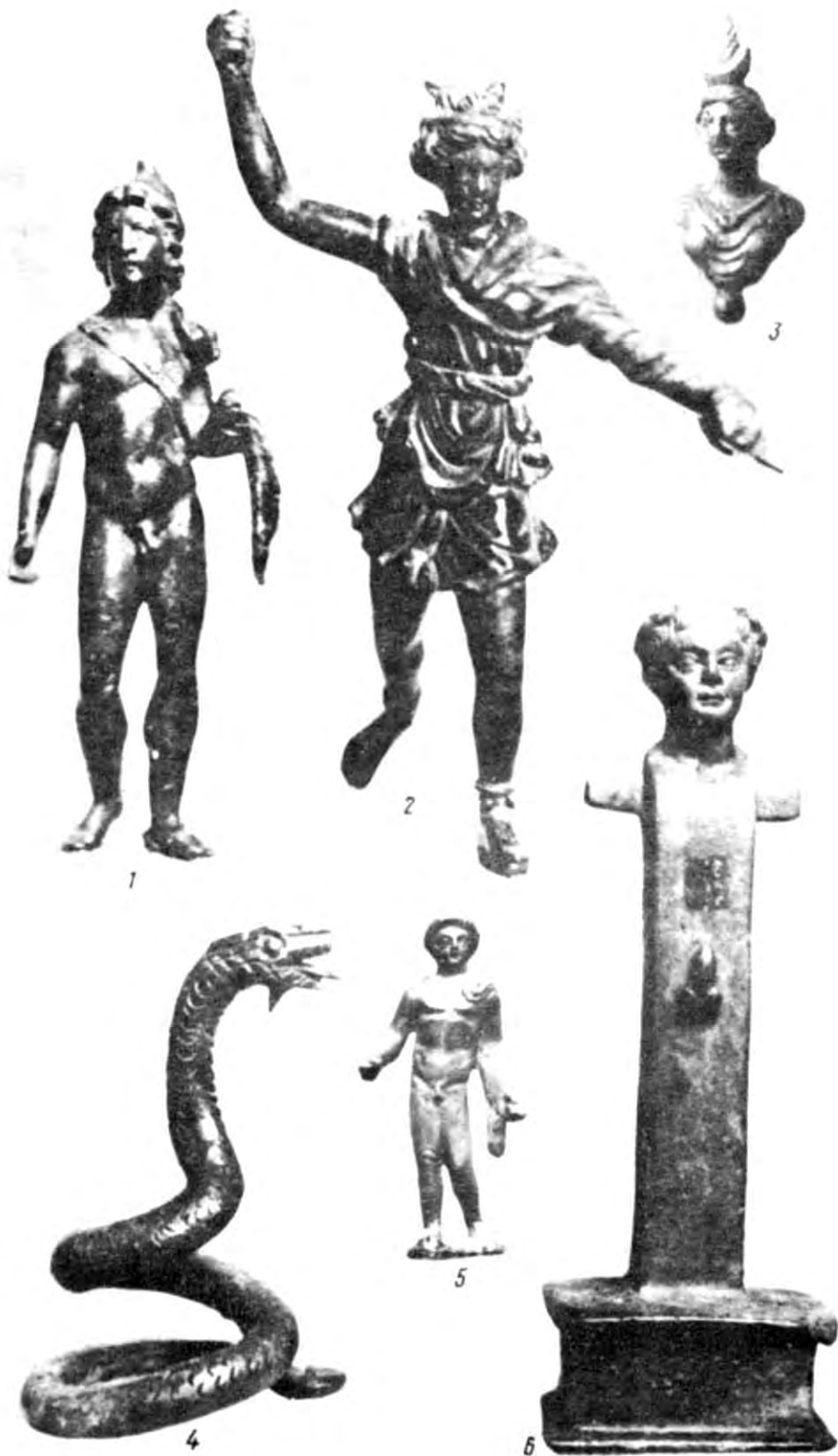
Рис. 5. Бронзові статуєтки з розкопок святилища біля перевалу Гурауфське Сідло (зображення подано в натуральну величину).