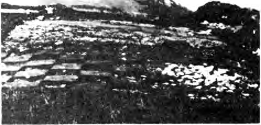
Рис. 1. Розкопки шару світлої глини з неперепаленими кістками з розвалом жертovníка та перекриваючим його зольником на східній ділянці святилища. Вид зі сходу.

з часом розсипалося. Серед каміння дуже багато зубів тварин. Там же знаходились бронзові предмети: кілька деталей окуття ложа, аналогічних знайденим в Артюхівському кургані 4 , ланцюг і платівка у вигляді лунниці. Очевидно, конструкція з необробленого каміння була жертovníком.