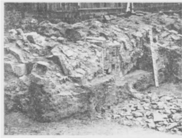
Рис. 1. Рів X ст. і завалена стіна ротонди.

1976 р. в садибі № 3 на вул. Володимирській і на спортивному майданчику школи № 25 м. Києва тривали розкопки пам'ятки архітектури XII- і XIII ст. — ротонди 1 . Дослідників особливо цікавили залишки будівельних матеріалів X ст., знайдені у фундаментах північної частини пам'ятки: уламки широкоформатної тонкої плінфи завтовшки 2—2,5 см, фрагменти штукатурки з фресковим розписом, шматки цем'янки. Незабаром у центрі ротонди під заваленою стіною і опорним стовпом виявили неглибокий рів завширшки 1,6 м, що тягся зі сходу на захід — понад 8 м. Його заповнювали такі самі матеріали, як і в фундаментах ротонди, але, крім того, траплялись мозаїчні кубики, фрагменти голосників, окремі камені-кварцити, деякі з відполірованими гранями, кілька уламків мармуру 2 .