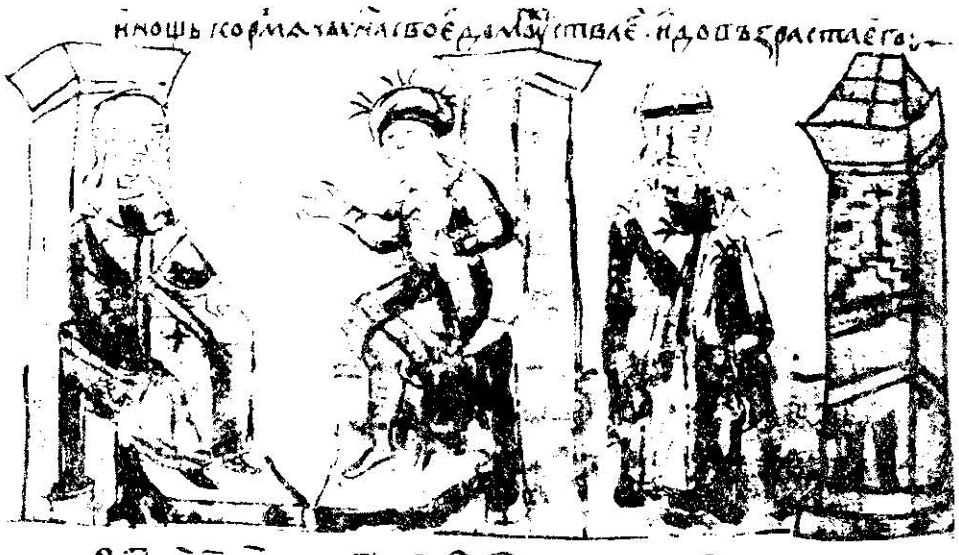
Рис. 3. Зображення княгині Ольги перед храмом. Ольга молилася за сина і за людей. Мініатюра Радзивілівського літопису.

Виникає запитання, хто ж звів цю загадкову культову споруду? За літописом, Святослав до смерті (972 р.) жив за язичницькими звичаями 9 . Його мати, княгиня Ольга, за тим самим літописом, прибувши 955 р. до Константинополя, охрестилась і отримала в хрещенні ім'я Олена 10 (померла 969 р.) 11 .