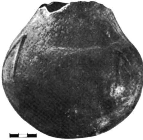
Рис. 4. Кубок з пох. 4, кург. 3 біля с. Перемоївка.