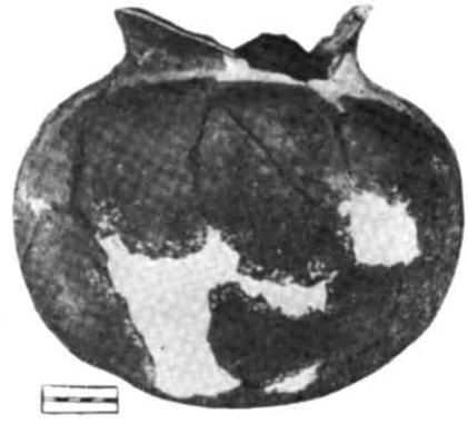
Рис. 2. Кубок з пох. 2(8) в с. Грушівка.