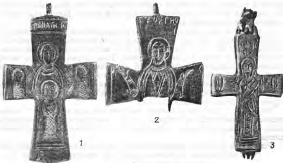
Рис. 8. «Сірійські» енкалпіони: 1—3 — Херсонес.

Однією з головних сюжетно-композиційних рис найбільш поширених на Русі енкалпіонів з київських майстерень була схематична композиція складня Христос — Богоматір, тобто, на лицевій стулці зображений Христос, а на зворотній Богоматір. У «сірійських» рельєфних складнях дотримано саме цієї схематичної залежності. Мабуть пояснити це можна тим, що в XI ст. виробництво складнів уже було стабільно налагоджено, як у візантійських провінціях, так і у давньоруських майстернях.