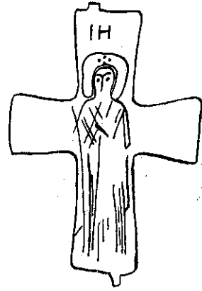
Рис. 5. Близькосхідний енкалпійон з Румунії.

свій хронологічний розвиток. На гравюрі енкалпіона з Княжої гори Богородиця стоїть з піднятими руками. Біля її ніг зображено немовля. Подібний сюжет М. П. Кондаков відносить до найбільш ранніх 16 . Енкалпійон з аналогічним положенням фігури і абсолютним збігом орнаментативної знаходимо в Моравії (рис. 6, 2) 17 .