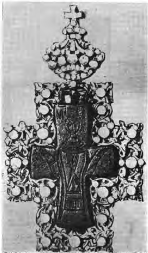
Рис. 3. «Сірійський» енколпion з музею м. Берліна.

з короткими описами у працях останніх десятиліть. Ймовірна і їх наявність у фондах музеїв і руках колекціонерів. З наявної кількості екземплярів частина знайдена у Середньому Подніпров'ї.