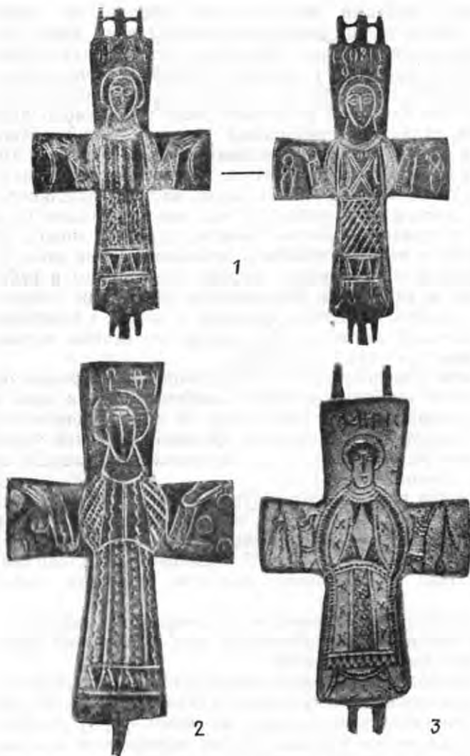
Рис. 1. «Сирійські» енколпіони: 1 — Київ, 2 — Біла Вежа, 3 — Білгород-Дністровський.

їх не завжди вдається. Деякі з них мають орфографічні помилки. Візантійська епіграфіка, і, зокрема, написи на предметах образотворчого мистецтва все ще погано вивчені 6 .