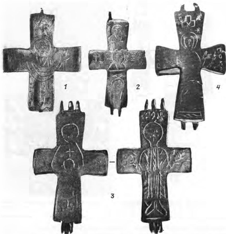
Рис. 4. Близькосхідні енколпіони: 1 — Київ, 2 — Угорщина, 3 — Болгарія, 4 — Гніздово.

досконалого зразка, але в Угорському національному музеї існує аналогічне зображення на складні, що відноситься автором його публікації до палестинського кола культової пластики (рис. 4, 2) 12 . Очевидно, обидва екземпляри, як і віддалені аналогії із Гнездова (Смоленської області) (рис. 4, 4), Болгарії (рис. 4, 3) і Румунії (рис. 5) 13 , що мають ряд характеристик «сірійських» енколпіонів (технологія, форма, стиль композиції), можна віднести до окремого типу складнів, пов'язаних з класичними зразками близькосхідної культової металопластики.