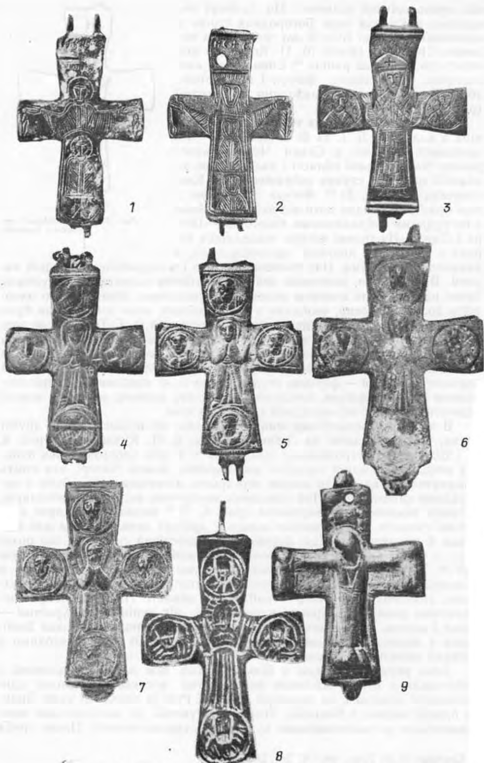
Рис. 6. «Сірйські» енколпіони: 1-4 — Княжа гора, 2 — Моравія, 3 — с. Сивки, 5 — Дівич Гора, 6 — Білгород-Дністровський, 7 — Херсонес, 8 — Болгарія, 9 — Остер.

відзначити, що рельєфні складні з цих територій різняться за стилем виконання загальних рис персонажів, зображених на них.