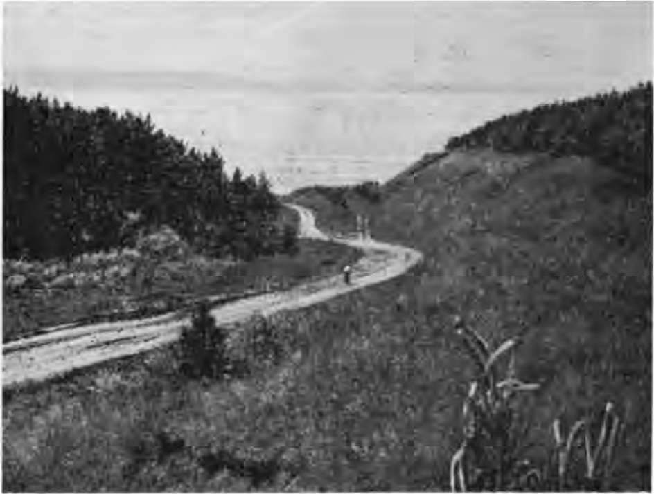
Рис. 4. Спуск до Волги в районі Кайбельського городища.

Розглядаючи цей варіант маршруту як нереальний, була зроблена спроба виявити інше місце переправи. На думку учасників експедиції, переправа через Волгу в бік Русі, а також обулгаризованої Буртасії та мордовських земель, знаходилась південніше сучасного Ульяновська, в районі сіл Хрестово-Городище — Кайбели (лівий берег) та Криуші (правий берег) (рис. 4). Тут з обох боків річки, що розділялась на два русла (з яких ліве можна було перейти вброд) розміщувалось по два городища (Хрестово-Городищенське і Андріївське на лівому березі, Криушське I, II на правому), що охороняли переправу 12 . На середині ріки знаходився зручний для переходу та випасів широкий острів. Зручними були і похилі схили — спуски до річки. Вірогідно, що якраз тут знаходилась друга днівка-манзіль караванів.