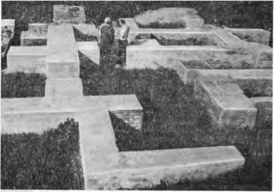
Рис. 3. Фундаменти караван-сараю в Білярі.

ний захід спочатку по відносно високому правому березі річки Джавшур (Малій Черемшан). Перша зупинка (днівка — манзіль) припадала на Кокрятьське городище, що розташоване на правому березі р. Утки (Ватиг за свідченням арабського мандрівника Ібн-Фадлана) приблизно в 75—80 км від Великого міста. Ця відстань за Ідрісі—Б. О. Рибаківим дорівнює дводенному переходу каравана, після чого, як правило, люди, коні та верблюди відпочивали протягом одного дня.