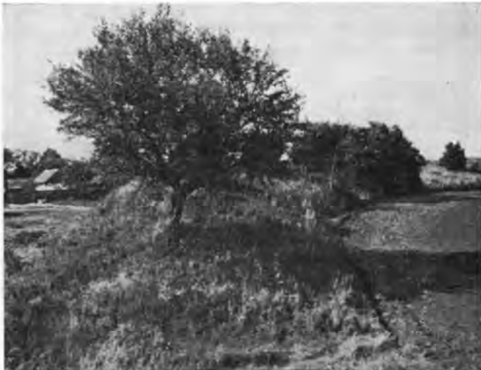
Рис. 5. Вали літописного В'яханя.

з Булгара в Київ. Завершувалася ця частина якраз у районі, який до наших часів називається Ертіль. Найімовірніше, це давній тюркський (булгарський) топонім, що означав середину шляху*. На вказаному проміжку були виявлені і оглянуті можливі пункти зупинок: селище «Перевоз» на р. Вороні в Тамбовській області, а також археологічний комплекс пам'яток «Щуч'є» в районі злиття річок Ертіль та Битюг у Воронежській області.