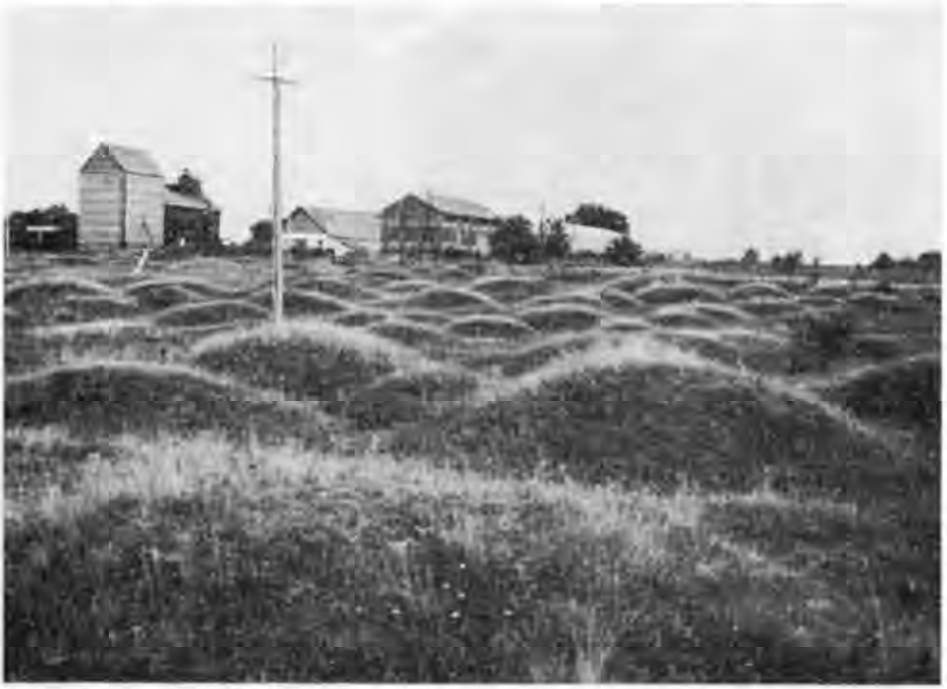
Рис. 6. Кургани в с. Липове.

міщені на високому корінному березі Псла, можна за їх плануванням відносити до так званих відкритих торговельно-ремісничих поселень, які відрізняються від інших населених пунктів середньовічних часів наявністю невеликих укріплень, проживанням більшості населення на відкритих поселеннях та значними за розмірами могильниками 18 .