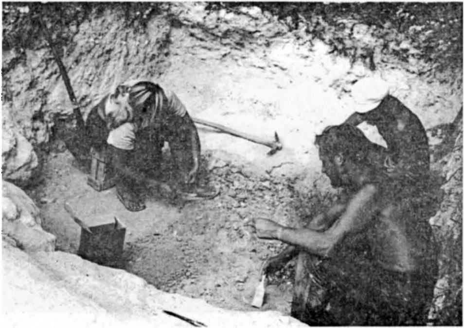
Розкопки стоянки Заскельне V. 1993 р.

На початку 60-х років Ю. Г. Колосов береться за вивчення палеоліту Криму. Він штудіює археологічні звіти й літературу, знайомиться з матеріалами розкопаних пам'яток, проводить розвідки в районі р. Бодрак і додаткові розкопки дослідженої Г. А. Бонч-Осмоловським на початку 20-х років мустьєрської стоянки Шайтан-Коба. Одним з перших серед вітчизняних дослідників застосувавши для аналізу крем'яної колекції цієї пам'ятки типолого-статистичний метод Ф. Борда, він аргументовано доводить наявність тут двох культурно-хронологічних комплексів. Такою ж ґрунтовністю відзначався і висновок про існування в палеолітичний час південно-західного шляху, яким через Тарханкутський півострів могли прийти у Крим з Малої Азії носії левалуазької технології. Ці розробки лягли в основу захищеної у 1967 р. кандидатської дисертації і першої монографії.