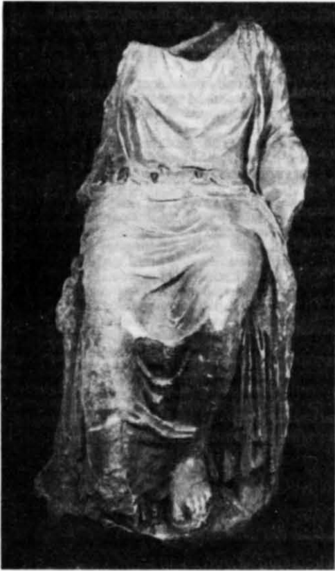
Рис. 5. Скульптура жінки. Вид спереду.