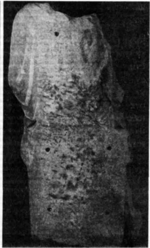
Рис. 6. Тильна сторона скульптури.

притиснутий коліном гіматій опускається до основи скульптури групою вільно спадаючих складок. Особливо рельєфно модельована нижня частина одягу, де вертикальні краї тканини зроблені загостреними, глибина проміжків між складками — до 1,5 см. Під лівою рукою, біля різка табурета, простежується потовщення тканини.