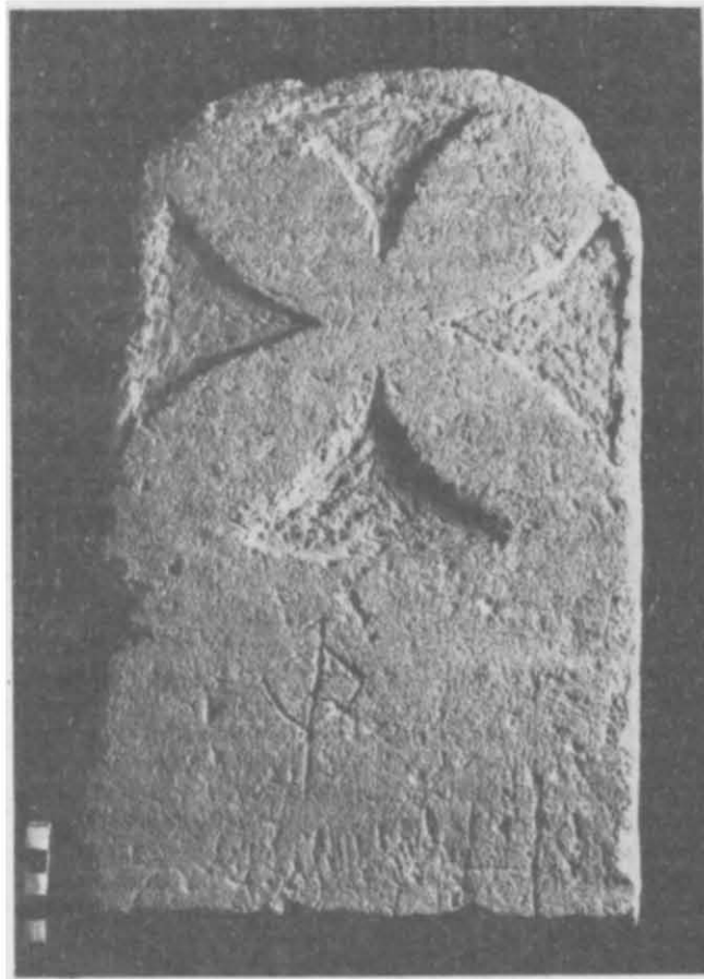
Рис. 1. Стела из некрополя Херсонеса (сторона А).

В 1996 г. в Национальный заповедник «Херсонес Таврический» поступила плита с двусторонним изображением и греческими надписями, случайно обнаруженная на территории Херсонесского некрополя у Карантинной бухты, неподалеку от так называемого загородного храма.