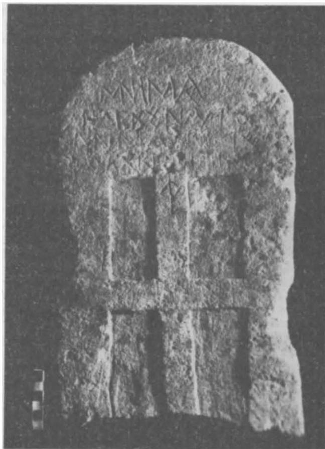
Рис. 2. Стела из некрополя Херсонеса (сторона Б).

Вырезанный в верхней части стелы (сторона А) крест, вписанный в круг неправильной формы, образован четырьмя дугами. Лопастей креста, сильно расширяющиеся к концам и сужающиеся к центру (немного варьирующие в размерах), не смыкаются в центре. Они выбраны на глубину 0,005 м. Закраина сверху и с боков неровная, толщиной от 0,01 до 0,017 м. Крест в круге выполнен достаточно небрежно — заметны следы обработки, подтески острым инструментом. Большинство подобных стел с изображением креста в круге, найденных в Крыму, в том числе и в Херсонесе, выполнены с большей тщательностью. Такие кресты в круге на памятниках Крыма чаще всего выполнялись с разметкой циркулем 6 . В центре креста просматривается точка, очевидно, от этого инструмента. Такие же четыре точки хорошо видны вверху, внизу и по