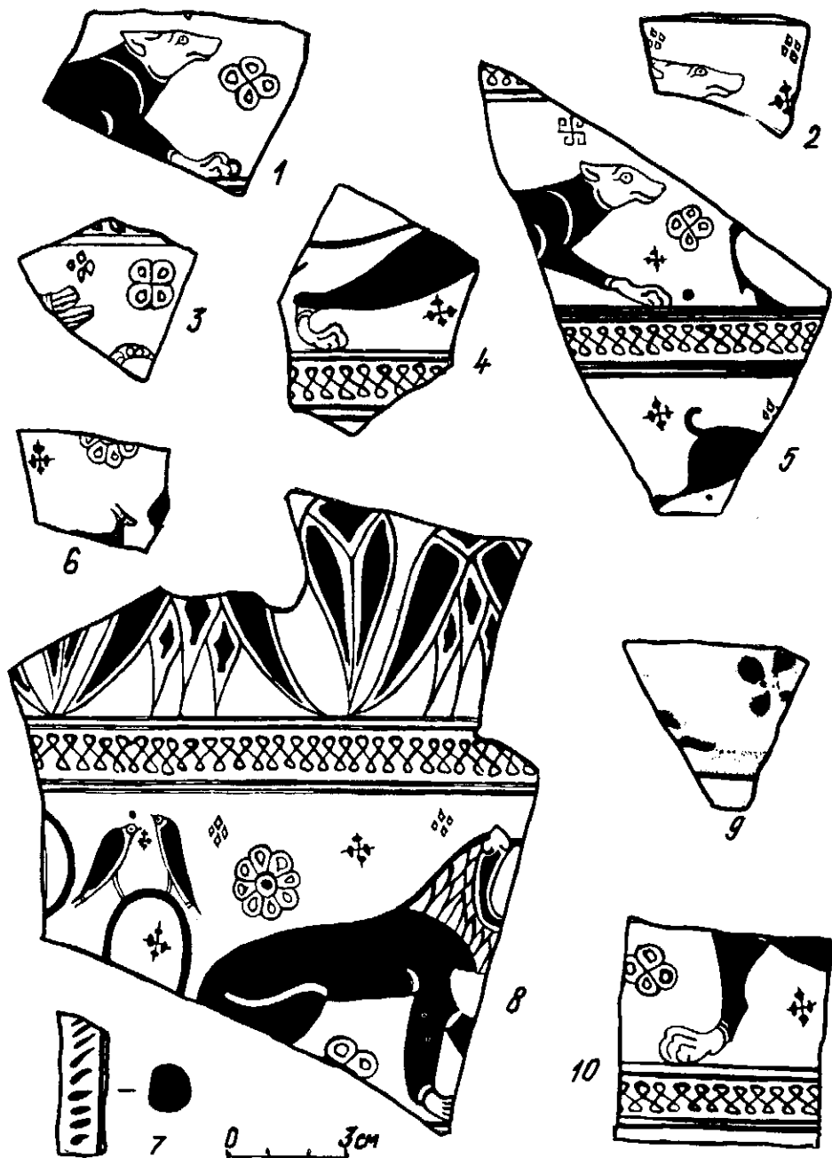
Рис. 2. Фрагменты греческой керамики ориентализирующего стиля из раскопок Пемировского городища.

ми, оставленными в цвете ангоба и подчеркивающими мускулатуру животного, а также на шес, лак разбавлен и имеет красноватый оттенок, выразительно оттеняя детали изображения. От этого же сосуда, очевидно, от других фризов, сохранились еще два фрагмента 44 — один с изображением задней ноги и хвоста собаки, другой — с частью ноги льва (?) и спины копытного животного.