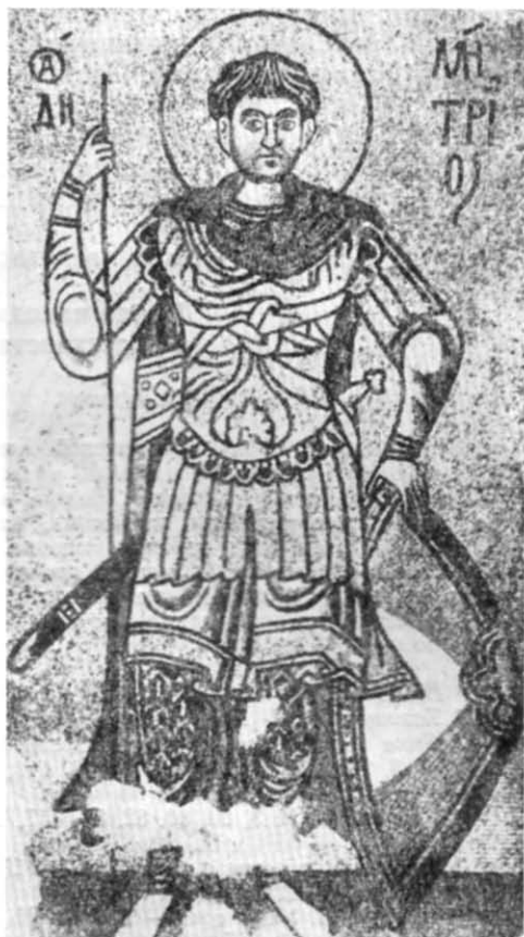
Рис. 4. Зображення Дмитра Солунського з Михайлівського Золотоверхого собору в Києві (часи Ізяслава Ярославича).

Таким чином, немає нічого фантастичного у припущенні, що й Миколаївський (Микільсько-Пустинний) монастир був заснований за врядування Ізяслава Ярославича десь скоро за Печерським і теж дістав від нього певне земельне пожалування — угіддя у Дніпровій заплаві на лівому березі ріки. Не підлягає сумніву, що Ізяславові бенефіції монастирям мали належне юридичне оформлення у вигляді офіційно стверджених (і завірених) грамот.