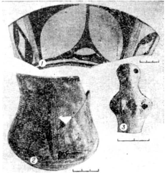
Рис. 3. Імпортні керамічні вироби поселення Гарбузин.

Ще в другому періоді розвитку східного регіону намітилися тенденції до інтеграції племен, що просувалися з Подністров'я в район Південного Бугу та Буго-Дніпровського межиріччя. Цей процес раніше всього простежується на Південному Бузі. Великий процент посуду з кукутєнським розписом та пластика, виявлені в житлах Кліщева 46 , підтверджують цю думку. В Буго-Дніпровському межиріччі він стосується заключного етапу Веселокутського поселення, досягнувши в цей час лише території басейну Гірського і Гнилого Тікича. Пам'ятки басейну Росі і Дніпра процес інтеграції охоплює і значно пізніше, тобто у третьому, заключному етапі розвинутого Трипілля східного регіону, про що свідчать вищезгадані матеріали пам'яток типу Володимирівки, знайдені в Гарбузині (рис. 3). Послаблення в цей час давніх традицій, притаманних населенню східного регіону, призвели до асиміляції населення Буго-Дніпровського межиріччя племенами, що просувалися сюди з Побужжя.