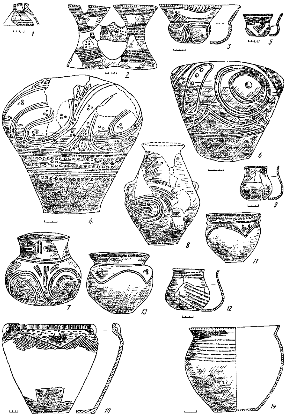
Рис. 2. Кераміка з поселень східного регіону:

1-3, 5, 9, 10, 12 — Шкарівка; 4, 6, 7 — Веселий Кут; 8, 11, 13 — Верем'я, 14 — Миропілля.