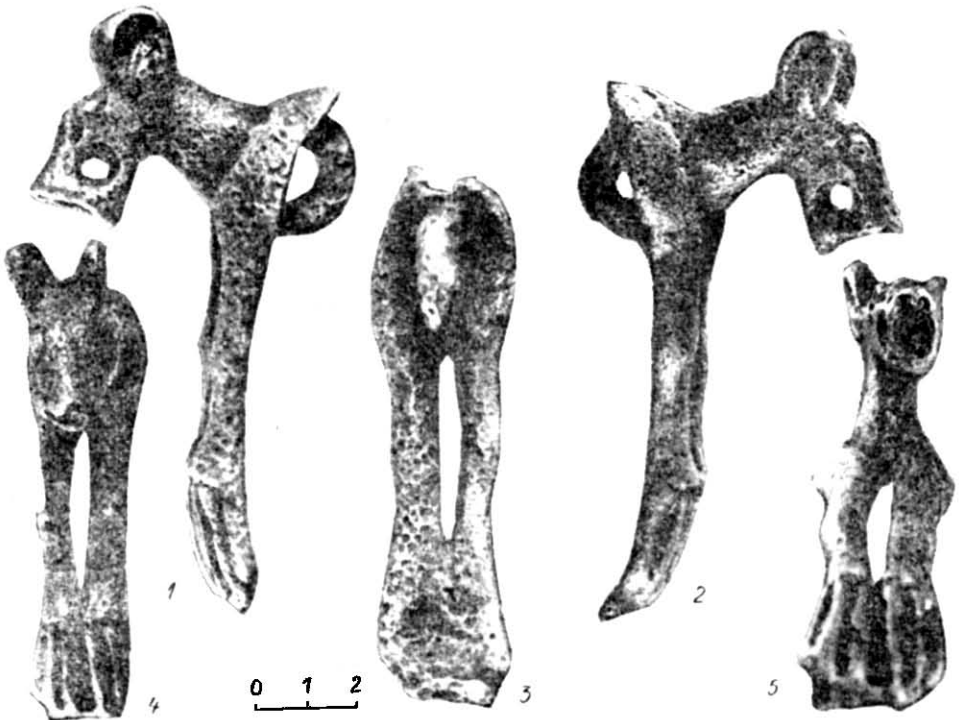
Рис. 1. Бронзовий наносник з Одещини: 1, 2 — профіль; 3 — тильний бік; 4 — фас; 5 — ніздрі та паща.

Наносник являє собою бронзову бляху зі скульптурно виступаючою вперед у верхній частині голівкою хижака кошачої породи з непромірно