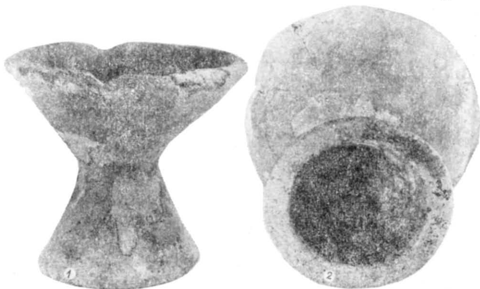
Рис. 3. Чаша з поховання № 1: 1 — загальний вигляд; 2 — ніжка чаші.

Для визначення часу існування «випростаних» поховань відомостей ще не достатньо. Стратиграфічно вони передують похованням пізньоямного часу. Безпосередня стратиграфія з похованнями ранньоямного часу відсутня. Верхня межа часу існування поховань визначається за знайденими в них пізньотрипільськими статуетками «серезліївського» типу (с. Широке, курган № 1, поховання № 18, м. Орджонікідзе, курган