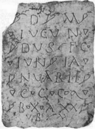
Рис. 1. Напис № 1.

1. Прямокутна плита з сірувато-білого мармуру з восьмирядковим написом, що зберігся повністю. Інв. 1037. Розміри: висота 23,5 см, ширина 17 см, товщина 3 см. Трохи відбитий лівий верхній кут. Лицьовий бік покритий жовтуватою патиною і має багато темних прожилок, залишених коріннями рослин, які на фотографії легко переплутати зі слідами різця. Так, букву С в кінці третього рядка можна прийняти за Е через темну горизонтальну рисочку всередині, а в останньому ряду «прочитати» ще одну букву — Р або R (рис. 1).