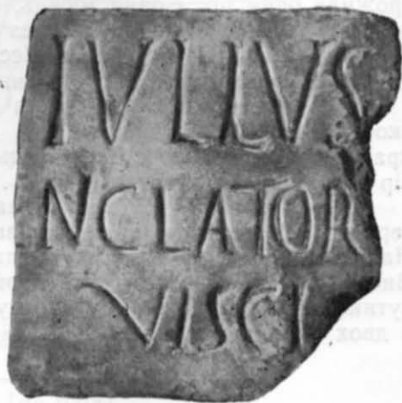
Рис. 5. Напис № 5.

У третьому рядку, певно, родовий відмінок від чоловічого імені Viscus . Воно зустрічається у Римі, Північній Італії та Далматії 28 , і за думкою лінгвістів, етрусського походження 29 .