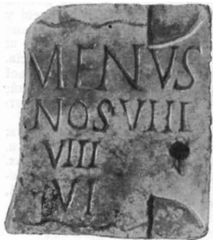
Рис. 4. Напис № 4.

Цікавий, безсумнівно, доповнюючий термін номенклатор. Так йменувався у Римі раб, який зобов'язаний був супроводжувати свого хазяїна і називати імена людей, що зустрічалися на вулиці або приходили в його дім. Номенклаторів звичайно мали при собі великі посадові особи; входили вони і до свити імператорів 27 .