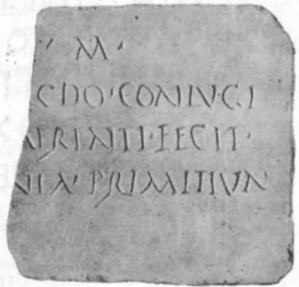
Рис. 2. Напис № 2.

Лицьовий бік відполірований, зворотний — грубо оббитий. Краї зглажено і злегка скошено для вставлення у вапняковий надгробок. Напис зроблено глибоко за тонко накресленими лінійками. Висота літер 1,5—1,6 см, відстань між лінійками 1,4—1,5 см. Між словами поставлено розділові знаки у вигляді ком та витягнутих трикутників. Форми і вигини ліній деяких букв наближають письмо до курсивного. P і R мають незамкнену петлю, R — далеко відставлену ніжку; F — широкий штрих внизу, що наближує цю букву до E, у N друга вертикаль не зникається внизу з діагоналлю, майже всі літери прикрашено на кінцях потовщеннями і штрихами 12 . Палеографічні особливості напису в цілому дають змогу датувати його кінцем II або III ст. н. е.