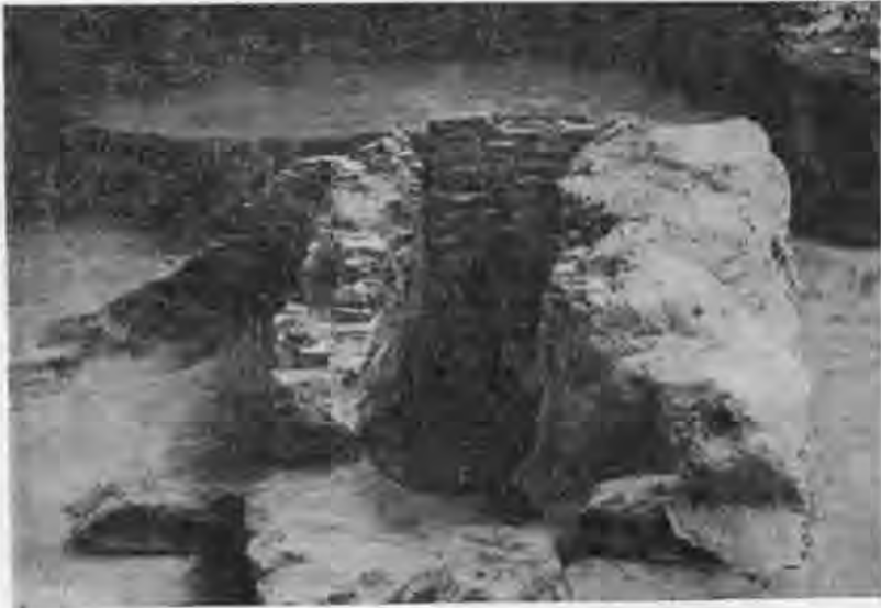
Рис. 5. Піч для випалу плінфи. X ст. Старокиївська гора.

Характеризуючи архітектуру стародавнього Києва, дослідники неодноразово відмічали, що незвичайні для тих часів масштаби будівництва вимагали налагодженого місцевого виробництва всіх необхідних будівельних матеріалів. Теоретично незаперечний, висновок цей довгий