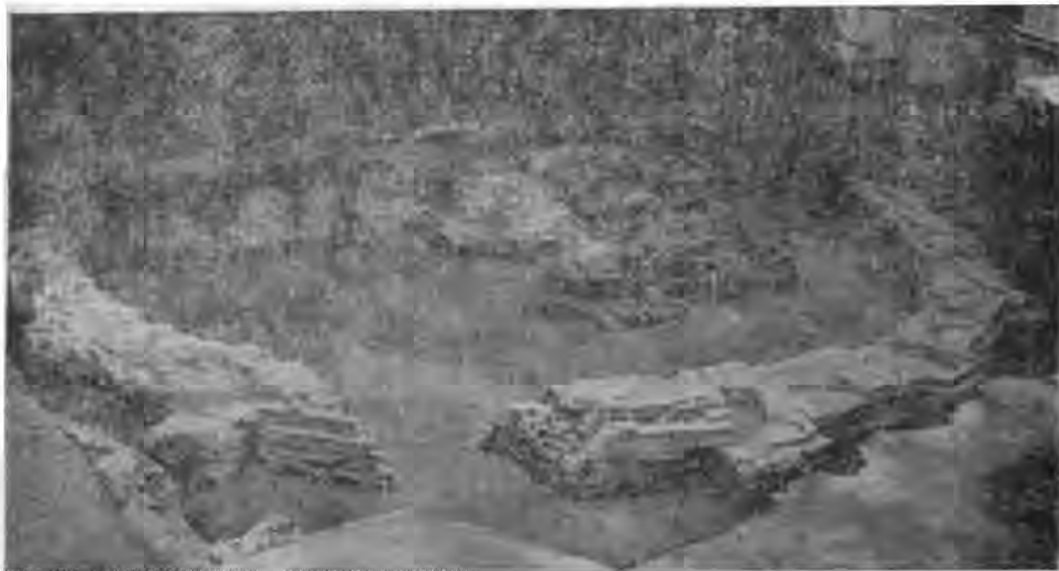
Рис. 7. Київська ротонда. Кінець XII—початок XIII ст. Східна частина.

Київська ротонда була значною архітектурною спорудою, внутрішній діаметр якої дорівнював 17, а зовнішній — понад 20 м. Потужність фундаменту і цоколю свідчить, очевидно, про висотну архітектуру бу-