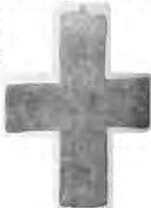
Рис. 11. Хрест-енколпійон. Хст. Київ. Микільська Слобідка.

Ще одну печатку некиївського походження знайдено під час розкопок 1975 р. в садибі № 17 по вул. Волоській. На лицьовому її боці є грецький напис з чотирьох рядків, на зворотному — зображення св. Федора на повний зріст із списом у правій руці і щитом у лівій. Згідно з дослідженнями В. Л. Яніна, група бул протопродра Євстафія, до якої входить і наша знахідка, належала новгородському посаднику Завиду, що очолював політичне управління Новгороду за князя Мстислава Володимировича 27 . Це друга (з п'ятнадцяти) знахідок подібних печаток за межами Новгорода і Новгородської землі. До Києва вона потрапила, очевидно, разом із якоюсь грамотою, адресованою новгородським купцям. В будинку одного з них, можливо, старшини новгородської торгової колонії, її й було знайдено (рис. 10).