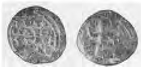
Рис. 10. Печатки протопродра Євстафія. XII ст.

Особливу увагу привертають чотири висячі свинцеві печатки, що свідчать про широкі економічні й політичні зв'язки Києва. Три з них виявлено на Подолі, а одну — в «городі» Володимирі. Остання, очевидно, пов'язана з пам'ятками візантійської сфрагістики. Вона досить велика (близько 3,5 см діаметром) і тонка. На одному боці — зображення святого із списом (Федір Стратілат), на другому — грецький напис, що читається так: «Святий! Будь милостивий до нищучого, Владика Стратілат»*. За палеографією літер печатку можна віднести до XI ст. З яким документом вона потрапила у Київ і від кого, сказати важко, але її візантійське походження, здається, не викликає сумнівів.