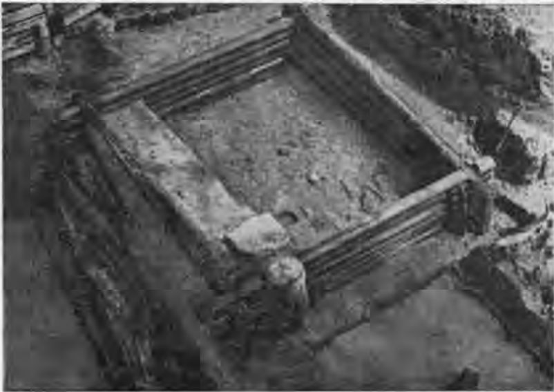
Рис. 2. Зруб. X ст. Поділ. Червона площа.

садибу X ст., рівень залягання якої — 10 м від сучасної поверхні. З усіх боків садибу огорожено дерев'яним парканом з широких дубових дошок. Довшою віссю вона витягнута вздовж берегової лінії, що й визначила її планувальну структуру. Чотири зруби розташувалися по периметру садиби і мали єдину орієнтацію; п'ятий, очевидно, ранніший, де-що випадав із загального плану. Вражає прекрасна збереженість зрубів; деякі з них мають по п'ять—дев'ять вінець (рис. 2).