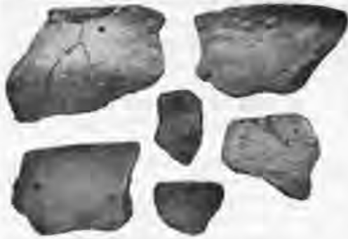
Рис. 1. Ліпна кераміка з житла VI ст.

В археології досить часто трапляється, що дискусійність того чи іншого питання зумовлена не стільки об'єктивними труднощами його вирішення, скільки недостатньою джерельною базою. Так сталося і з питанням масової житлової архітектури стародавнього Києва. Протягом понад 150 років археологи досліджували нагірну частину міста, де надзвичайно погано зберігається дерево. У зв'язку з цим основну увагу