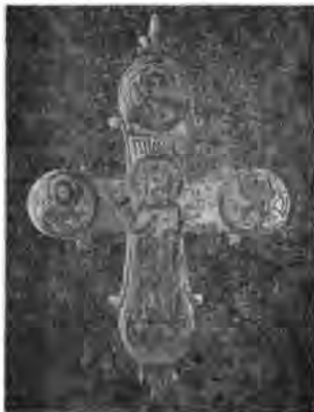
Рис. 12. Хрест-енколпійон. XII—XIII ст. Київ. Поділ.

Другий енколпійон (збереглася лицьова стулка) також відлито з бронзи. Фон його гладкий, рисунок наведено жирним черневим контуром. У центрі енколпійона міститься зображення Ісуса Христа з Євангелієм у лівій руці і піднятою правою рукою. Праворуч і ліворуч від нього, в круглих медальйонах, поясні зображення апостолів Петра і Павла, над Христом — архангела Михаїла. Нова техніка черні, як довів Б. О. Рыбаков, з'явилася на Русі наприкінці XII ст. 30 Отже, знайдений на Подолі у 1974 р. енколпійон слід датувати кінцем XII — 40-ми роками XIII ст. Як можна припускати, він був власністю людини, що належала до військового стану або мала християнське ім'я Михайло (рис. 12).