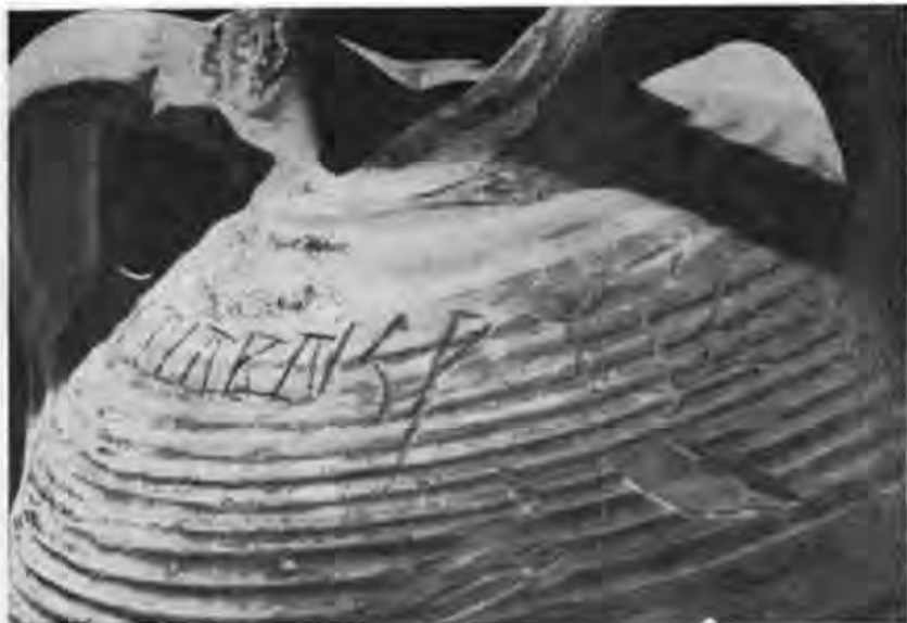
Рис. 8. Візантійська амфора з написом «МСТ(И)СЛ(А)ВЛ(Я) К(О)РЧ(А)-ГА». XII ст.

Значний інтерес становлять графіті на масовому археологічному матеріалі. Найбільше їх на червоноглиняних візантійських амфорах