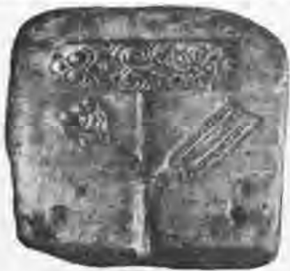
Рис. 4. Шиферна формочка для відливання накладних поясних пластин. X ст. Поділ. Вул. Верхній Вал.

У 1969 р. на території садиби № 41 по вул. Ярославській в шарах XII—XIII ст. простежено сліди давньоруських дерев'яних будівель, що згоріли. Серед матеріалів найбільшу колекцію становили знахідки бурштину, в тому числі не тільки окремі шматочки, а й заготовки до різних виробів та готова продукція: персні, багатогранні біконічні намистини, натільні хрестики, підвіски. Немає сумніву, що така велика кількість знахідок бурштину можлива лише поблизу ремісничої майстерні по його обробці 10 . Аналогічні залишки виявлено також у 1975 р. в межах садиби Покровської церкви.