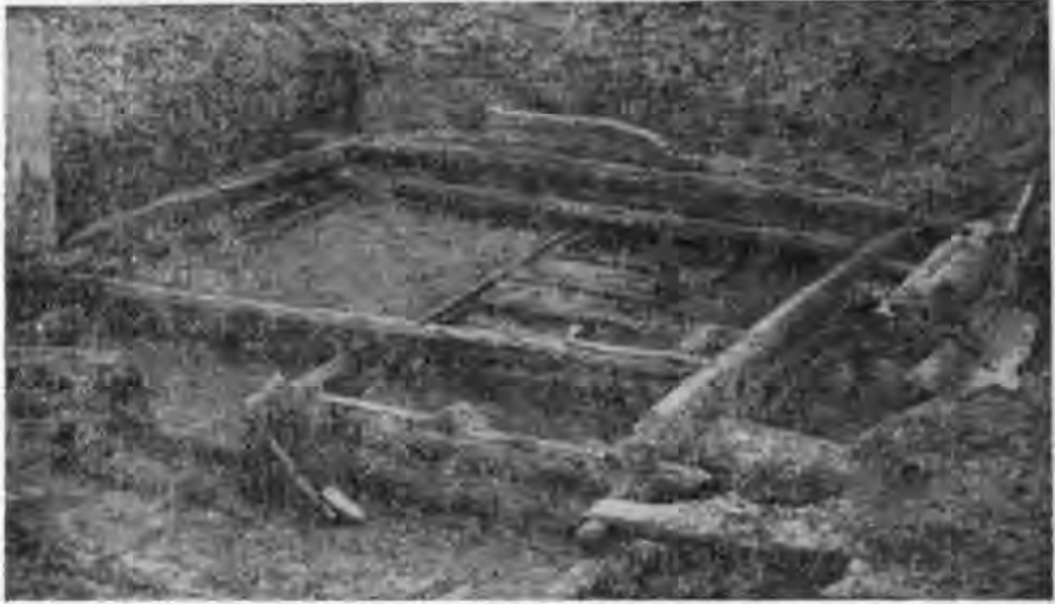
Рис. 3. Господарський зруб XI ст. Поділ. Житній ринок.

Житлові будинки однотипні. Це двокамерні будівлі (площею 28—34 м 2 ), рублені «в обло» з товстих соснових колод. Поміж вінцями