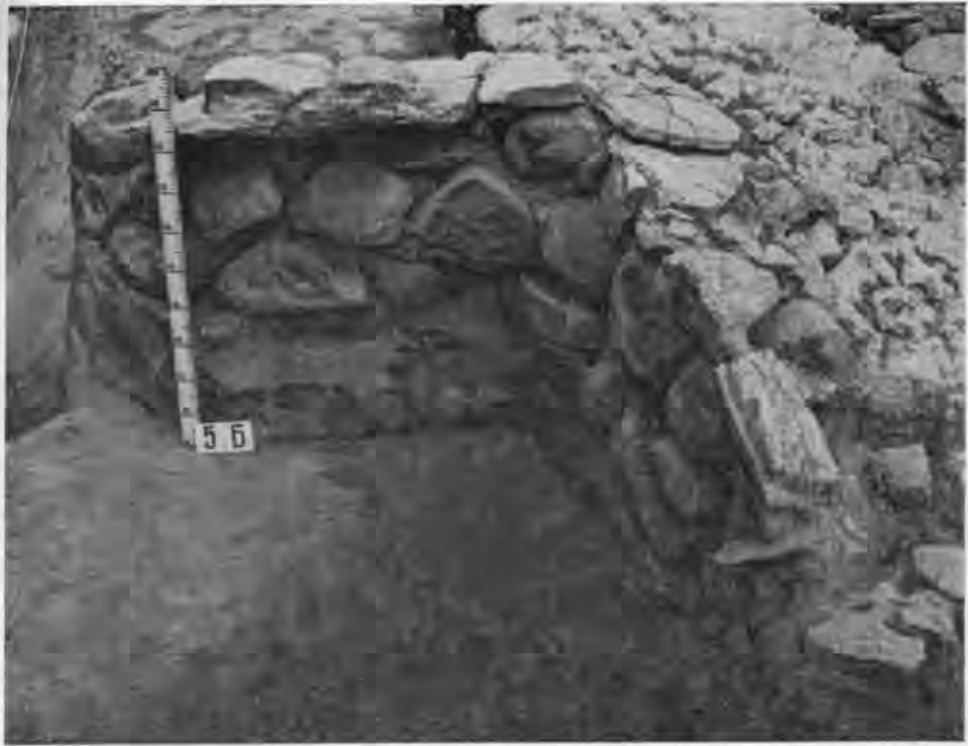
Рис. 6. Фундамент князівського палацу. X ст. Старокиївська гора.

Фрагменти фрескового розпису, полив'яних керамічних плиток, шиферних архітектурних деталей, шматків мармуру, знайдені під час розкопок, переконують в тому, що будівля була багато оздоблена. Як свідчить архітектурно-археологічний аналіз, це залишки найдавнішої кам'яної споруди Києва і Русі, значно старшої за Десятинну церкву. В питанні історичної атрибуції відкритого палацу немає особливих