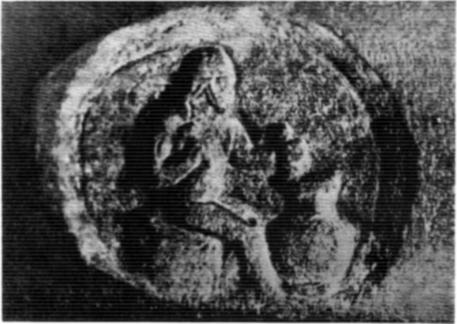
Рис. 2. Медальйон з зображенням ремісника на амфорній ручці.

Сам предмет і зображення настільки незвичайні, що довгий час їх стародавнє походження видавалося сумнівним. Тепер є нові дані, які переконливо підтверджують оригінальність знахідки і зв'язок її з періодом існування Кам'янського городища. На користь цього говорить насамперед зіставлення цього медальйона з фігурами двох скіфів, що шийють каптан з овечої шкури, на знаменитій пекторалі з Товстої Могили 1 . Постаті зображені з розворотом корпусу в три чверті і обличчям у профіль (рис. 3). У скіфа, зображеного справа, корпус розвернутий