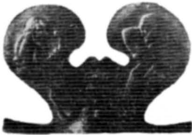
Рис. 5. Основа ручки патери з фігурами ремісників.

Цілком очевидно, що на ручці з Новочеркаського музею зображені не античні майстри, а варвари, з яких принаймні один працює над виготовленням античної посудини. Про це говорить специфічний одяг, наявність спільних традицій у зображених ремісників — скіфів Північного Причорномор'я, відсутність античних елементів в оформленні