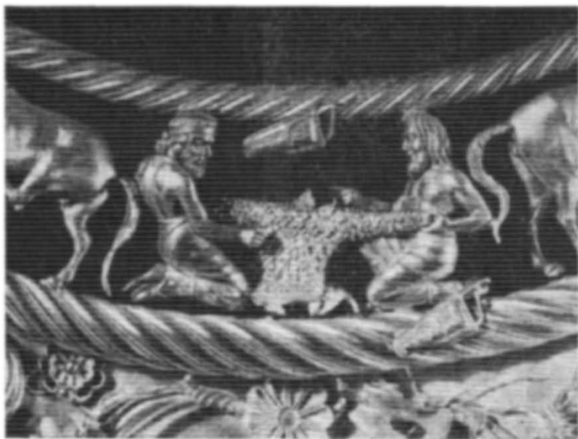
Рис. 3. Сцена зі скіфами, що шиють каптан, на пекторалі з Товстої Могили.

Порівняння з персонажами центральної сцени пекторалі (маються на увазі такі елементи, як стрічка-пов'язка, особливості передачі борода і волосся, шаровари і м'яке взуття) дає підставу припускати, що фі-