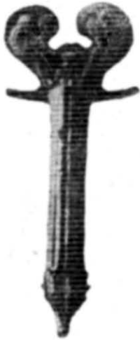
Рис. 4. Бронзова ручка патери з Новочеркаського музею.

Після виходу статті В. П. Шилова 5 навряд чи можна сумніватися в тому, що це ручка від бронзової патери, подібної до тієї, яка була знайдена в сарматському похованні кургану № 12 Нікольського могильника в Астраханській області. Ручка такої ж форми, округла в перерізі, з поздовжніми канелюрами, закінчується голівкою барана. Вона припаяна до корпусу патери за допомогою двох виступів, що йдуть по дузі, і фігурної основи (аташе) у вигляді волютоподібних плоских пелюсток, цілком аналогічних описаним вище. Ця знахідка підтверджує оригінальність предмета з Новочеркаського музею.