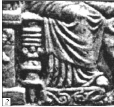
Рис. 7. Оздоблення ложа в багатофігурних композиціях: 1 — фрагмент теракоти з Міріни (за S. Besques); 2 — фрагмент вотивного рельєфу із Ольвії (за А.С. Русяєвою)

хідна частина Малої Азії, а надалі в північно-західному напрямку, де були виготовлені зразки теракот, що набули розвитку в Західному Причорномор'ї та Ольвії (рис. 6).