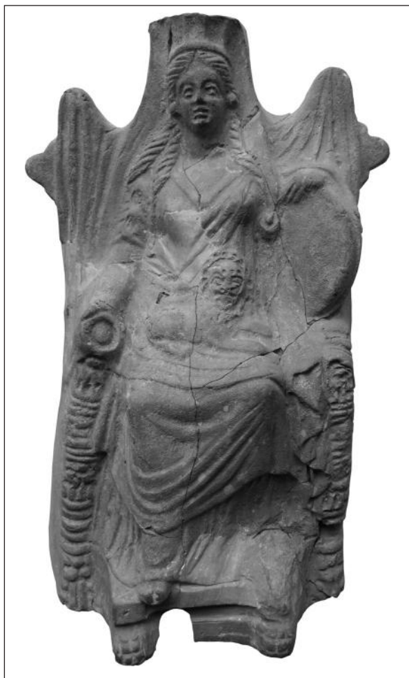
Рис. 2. Ольвія. Місцева фігурка із зображенням Матері богів (за А.С. Русяєвою)

Ольвійські теракоти Матері богів, безперечно, мали й певні особливості. На відміну від південніших античних центрів, де присутні дорослі леви (Vermaseren 1982; 1986; 1987), у нашому випадку переважали зображення левеняти, до того ж здебільшого на колінах богині. Не виключено, що це була данина архаїчній традиції, а, можливо, вона мала якесь релігійне підґрунтя, яке потребує окремого розгляду. Додамо, що в цей час в Ольвії Матір богів іноді іменували Фригійською матір'ю (Русяєва А. 1979, с. 104). У самій же Фригії цю богиню зображували майже завжди з дорослими левами обіруч. Як бачимо, в ольвійській іконографії така традиція майже не віддзеркалилася. Винятком є хіба-що дві знахідки: фрагмент мармурового рельєфу та світильник, але вже II ст. н. е. (IOSPE I, № 170; Kobylina 1976, № 12, pl. IX; Кобылина 1978, с. 72, № 17; Vermaseren 1989, № 516, 526, р. 152, 154). Ще однією місцевою традицією було переважання зображень подвійних виступів по обидва боки спинки трону,