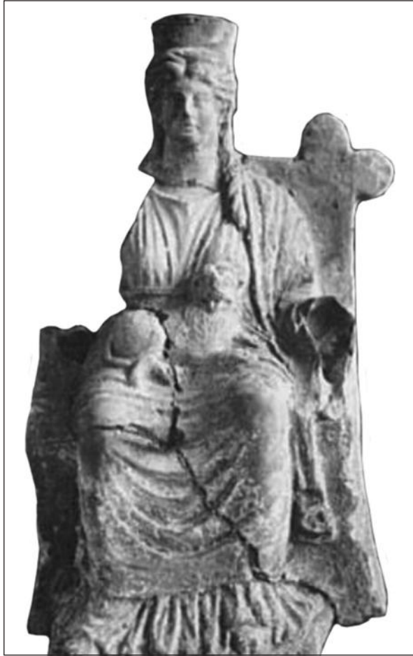
Рис. 4. Фігурка Матері богів з Каллатіса (за M.J. Vermaseren)

Найсуттєвішою зміною видається зображення левеняти не в ногах, а на колінах богині.