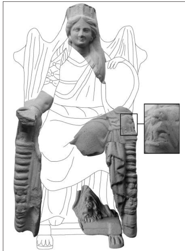
Рис 1. Ольвія. Реконструкція зображення Матері богів, відтвореного за двома довізними теракотами

Так само найпоширенішим саме в Мізії й Троаді вказаного періоду було зображення фіала з круглим виступом по центру, від якого відходять лінії до країв. Таке оздоблення називають «у вигляді колеса», «омфала», «променів», «розети» та ін. (Русяєва А. 1982, с. 87; Bald Romano 1995, р. 24, тощо). Його подібність до форми патери спричинила вживання цієї назви стосовно фіала Матері богів (Vermaseren 1987, № 52 et al.). Очевидно, теракотові зображення імітували металеві фіали з канелюрами та круглим виступом посередині, які завозили зі сходу в період архаїки, а в Причорномор'ї вони відомі в V—IV ст. до н. е. (Культура... 1983, № 80, 477). За римського періоду такі фіали називали патерами. Культурне призначення подібного керамічного фіала III ст. до н. е. підтверджується орнаментом з людських голів, розміщених по колу (Pisón et al. 2007, № 172). Висловлено припущення, що фіал у руках Матері богів міг символізувати приношення в ній плодів (Русяєва А. 1979, с. 104). Однак його форма була зручна для ритуалу узливання. Богів, що здійснюють узливання, зокрема й Матір богів, нерідко зображували з подібними канельовани-