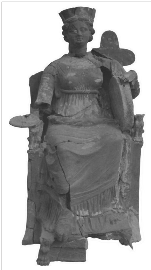
Рис. 5. Фігурка Матері богів з Гордіона (за M.J. Vermaeseren)

головою в інший бік, як на фігурці з Західного Причорномор'я, що опинилася в малоазійському Гордіоні (рис. 3), або без цієї деталі, як на пергамській теракоті з Гордіона (рис. 5), а могли подавати на колінах богині, як на місцевій ольвійській фігурці (рис. 2).