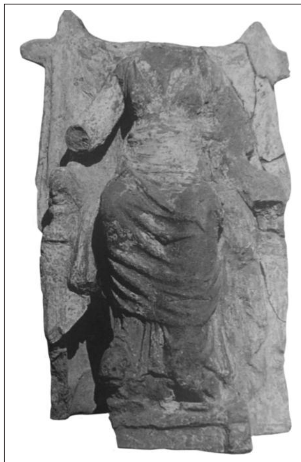
Рис 3. Фігурка Матері богів з Гордіона (за I. Bald Romano)

Схожість простежується за низкою ознак. Тут фронтальна частина боковин трону теж декорована, підніжжя має аналогічну будову і теж спирається на ніжки, стилізовані під лапи лева. Так само, як і на подібних малоазійських статуетках, які розглянемо далі, передано складки одягу (край гіматія спускається нижче колін, хітона — показаний щільними вертикальними брижами), а права нога на високій підосві сандалії випнута. Однак левеня вже розміщене на колінах, а гіматій вкриває фігурні виступи спинки трону. Крім того, стилістично зображення достатньо віддалене від розглядуваних двох фрагментованих теракот. Воно пізніше, хоча й наслідує раніший тип. Фігурку датовано першою половиною III ст. до н. е. Аналіз її сти-