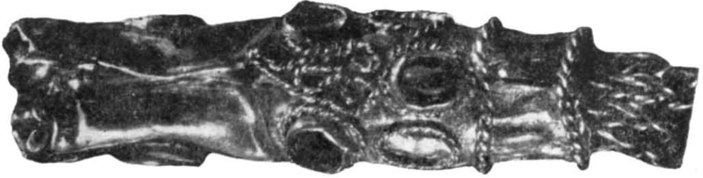
Рис. 3. Наконечник. Деталь шийного ланцюга.

Всі вище перелічені вироби, срібні й позолочені, складаються з порожнистої, прикрашеної зерню і сканню верхівки та прикріплених до