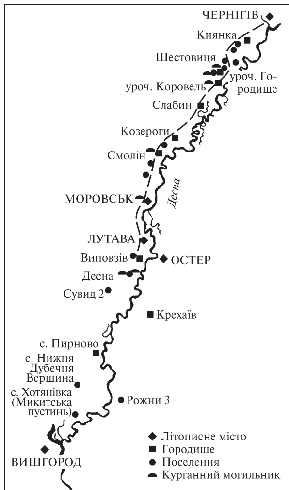
Рис. 1. Маршрут археологічної розвідки по «Шляху Мономаха» на правобережжі Десни

ревірити припущення Б. Рибаківа й розпочала обстеження давньоруських пам'яток уздовж імовірної траси старого шляху з Чернігова до Києва (як відомо, сучасна «пряма» дорога Чернігів — Київ була прокладена лише наприкінці XVIII ст.). Обстеженню підлягали, насамперед, городища — найбільш вірогідні пункти зупинок князівського почту (рис. 1).