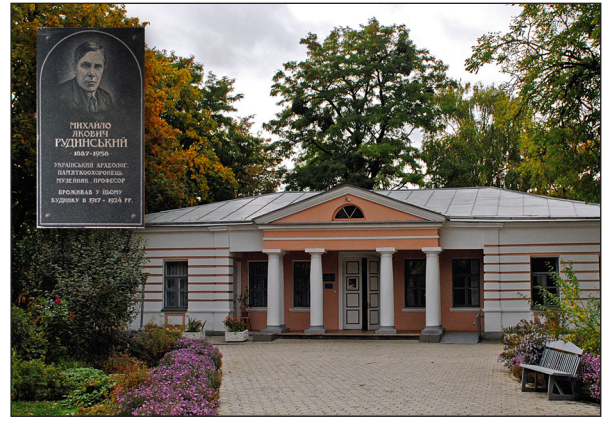
Фото 3. Будинок на садибі Літературно-меморіального музею В.Г. Короленка по вул. Короленка, 1 у Полтаві, де в 1917—1924 рр. квартирував М.Я. Рудинський і його сестри. Меморіальна дошка, встановлена 2002 р. (архітектор Т.В. Менчинська)

Також у ході роботи конференції презентовані три збірки наукових праць: Центру охорони та досліджень пам'яток археології Управління культури Полтавської облдержадміністрації, Центру пам'яткознавства НАН України і УТОПІК, Інституту археології НАН України і Полтавського краєзнавчого музею ім. Василя Кричевського « Старожитності Лівобережного Подніпров'я — 2017. Пам'яті М.Я. Рудинського » та Полтавського краєзнавчого музею ім. Ва-