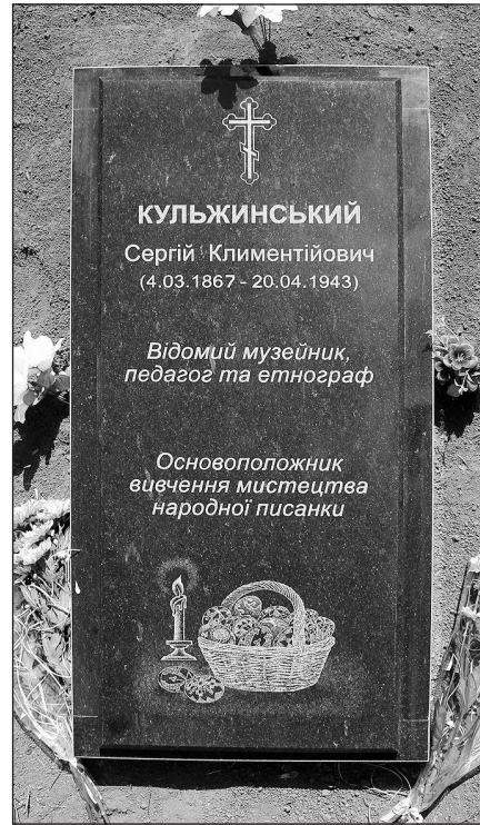
Рис. 4. Лубни, кладовище по вул. Д. Сірика. Надгробок музейника, встановлений у травні 2017 р. Архітектор В.О. Парістий, художник В.О. Пашкевич

руйнування еліністичних могил в маєтку генерала Фадєєва біля с. Парутиного на Миколаївщині 1889 р. (Каталог 1906—1912, арк. 69) тощо. Він же придбав для музею чимало античних монет, зразки розписного посуду класичного й еліністичного періодів з Керчі та Ольвійської хори, окремі амфори (Антична керамика... 1987, с. 8—11) та ін.