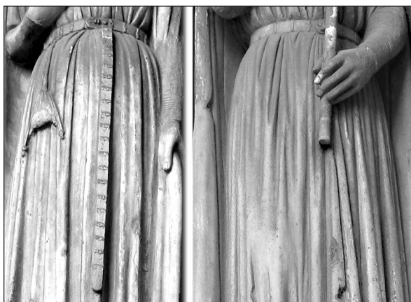
Рис. 2. Сен-Жермен л'Оксерруа. Збільшене зображення королівських поясів з двома типами розподільчих стовпців, аналогічних поясам зі стовпцями Чингульської Могили

користання таких оздоб на ремнях припадає на другу половину XIII–XIV ст. Стовпці, аналогічні закріплені на ремні 1, прикрашали пояс інфанта де ла Креда в іспанському Бургосі (близько 1275 р.). Присутні стовпці типу ременів 1 та 2 на поясах королівської пари з порталу собору Сен-Жермен л'Оксерруа в Парижі, що в XIV ст. служив королівською капелюю Лувра. Вузький пояс королеви прикрашений стовпцями з отвором на стрижні, а на такому ж поясі короля домінують стовпці без отвору, крім одного, розташованого перед пряжкою (рис. 1). Тут важливе сполучення стовпців різного типу на одному поясі (рис. 2).