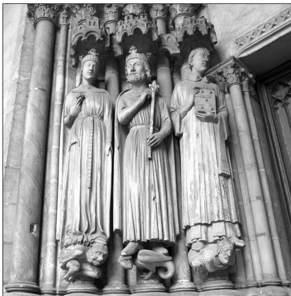
Рис. 1. Королівська пара в готичному портику церкви Сен-Жермен л'Оксерруа, Париж