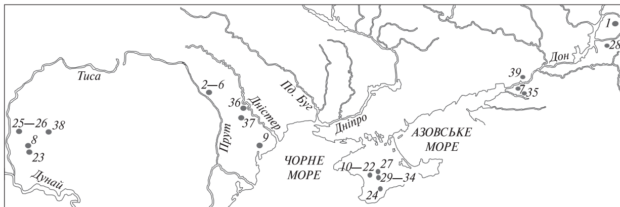
Рис. 1. Карта-схема жіночих пізньосарматських поховань з території Східно-Європейського Степу, залучених до дослідження: 1 — Абганерово II к. 13, п. 1; 2—6 — Бокани п. 5, п. 6, п. 9, п. 10, п. 17; 7 — Височино V к. 2, п. 2; 8 — Джармата II п. 26; 9 — Дивізія к. 2, п. 1; 10—22 — Дружне склеп 18, п. В; м. 21, п. Е; м. 24; склеп 58, п. С; склеп 66, п. А; склеп 66, п. В; м. 67, пд. підбій, п. 3 (нижній ярус); м. 67, пв. підбій, п. 2; м. 73, пв. підбій, п. В; м. 73, пд. підбій, п. D; склеп 78, п. D; склеп 84, п. А, п. D; 23 — Дудештій-Веки п. 2; 24 — Лучисте склеп 55, п. 2; 25—26 — Мако-Пап-хат I п. 2, п. 14; 27 — Мічурінське склеп 1, п. 1; 28 — Нагавський II к. 11, п. 1; 29—34 — Нейзац склеп 17, п. 1, п. 2; м. 103 (два похованих); м. 156; м. 208, п. 1, п. 2; 35 — Новоолександрівка I к. 20, п. 1; 36 — Пашкани п. 1; 37 — Трушень п. 1; 38 — Хунедоара-Тімішане п. 17; 39 — Чотири брати к. 3, п. 7

95 типів (позначаються арабськими цифрами), об'єднані в 10 класів (позначаються римськими цифрами) за кольором: I — безбарвні (Б); II — білі (Біл); III — чорні (Чор); IV — червоні (Чер); V — помаранчові (П); VI — жовті (Ж); VII — зелені (З); VIII — блакитні (Блак); IX — сині (С); X — фіолетові (Ф).