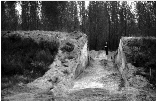
Рис. 4. М.П. Кучера в створі зробленого експедицією розрізу Змієвого валу неподалік хут. Хлепча на р. Стугна